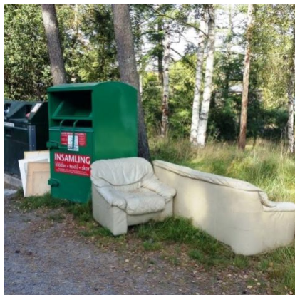
Återvinningsstationen i Lärkeröd den 16/9 2016.

Här finns en fin möjlighet för vår förening att göra en värdefull insats för vår hembygd! Ett par städdagar om året, kanske en i varje socken, då vi ger oss ut i grupper och samlar skräp ett par timmar för att sedan återsamlas och sortera soporna samt avsluta med korvgrillning/kaffekorg och lite social samvaro. Det kunde väl få vara en stående punkt på kommande års program!