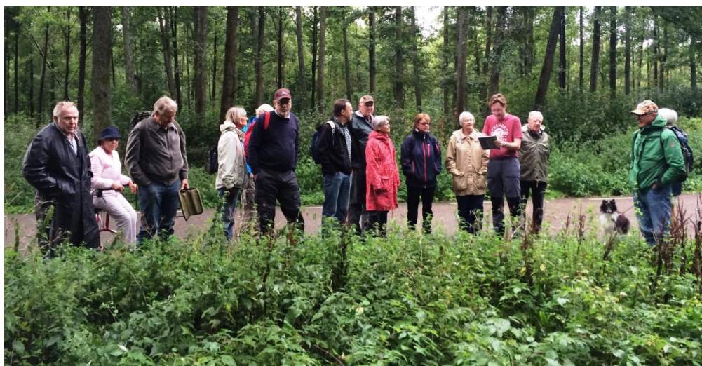
Torpvandrarna samlade vid den plats där torpet Fiskarehuset eller Försöket en gång låg. I alkärret bakom gruppen låg tidigare torpet Carlsro, mera känt som Stickehuset.