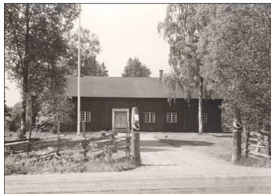
Hembygdsgården vid invigningen 1937

Trädgården har fjorårets nyplanterade fruktträd artat sig riktigt bra, så när som på att ett av dem visar tecken på sjukdom. Till våra gräsytor har vi under året köpt en ny och bättre gräsklippare.