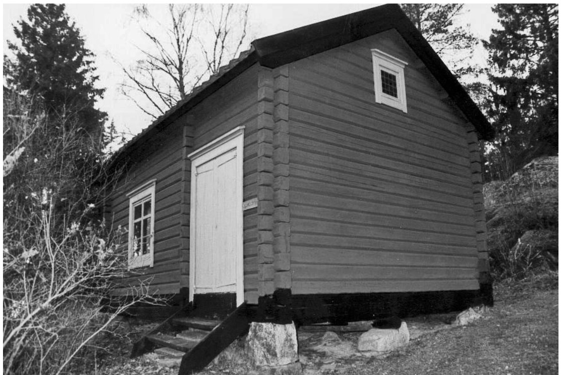
Lillstugan var föreningens första byggnad. Stugan inköptes 1912 för 150 kronor.