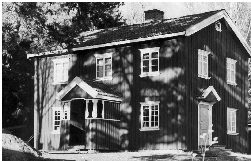
Uppförandet av Storstugan 1929-1930 medförde ett ökat intresse för föreningen.