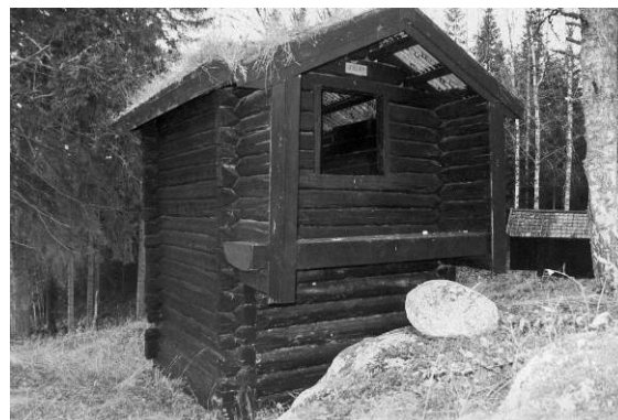
Tjölnan (el. kölnan) inköptes 1926