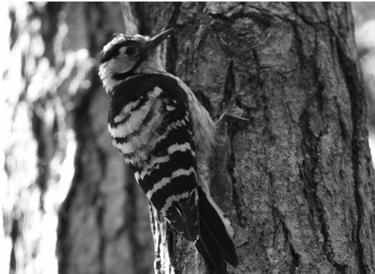
Den mindre hackspettshannen som inte är mycket större än en talgoxe häckar i gamla alsumpskogar.