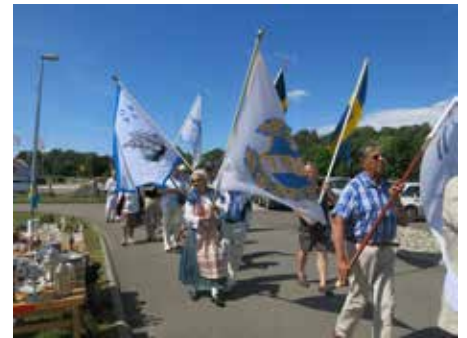
Nationaldagen den 6 juni anordnas av Onsala hembygdsdgille tillsammans med andra Onsalaföreningar vid Onsala kyrka.

Hör gärna av dig till någon av oss i styrelsen om just du vill vara med i vårt funktionärsgång.