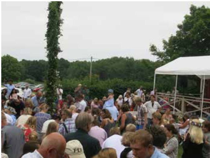
Midsommarfirande i solsken och värme.

Text: Agneta Linger