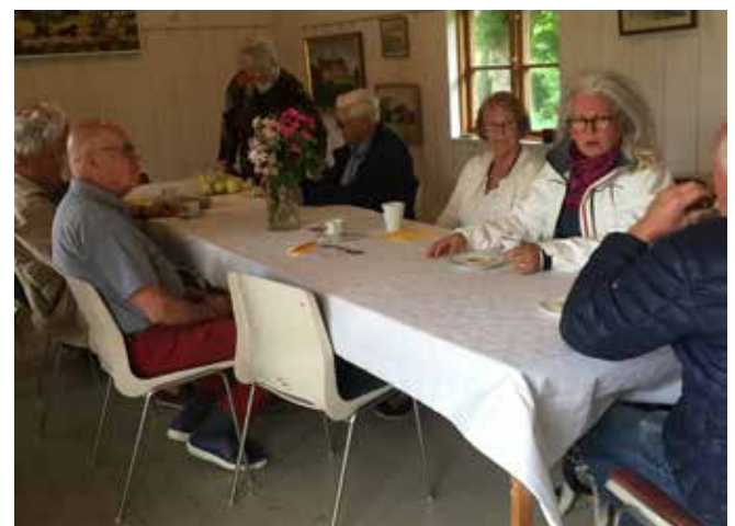
Fika i lilla ladan på Hembygdsgårdarnas dag.