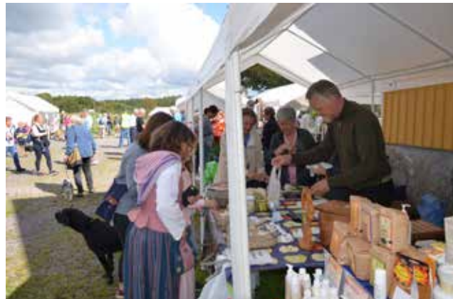
Nytt för i år på Apelrödsdagen var att alla utställare stod utmed den gamla färdvägen.