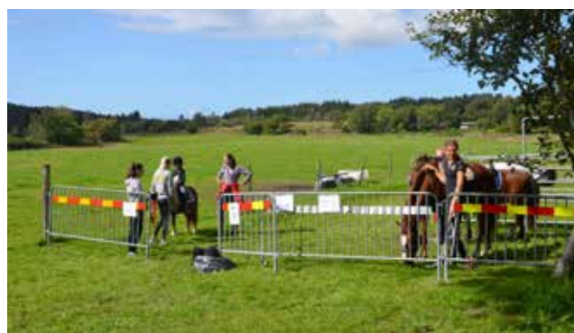
Ponnyridning för de yngsta är ett återkommande tema på gilletts aktiviteter.