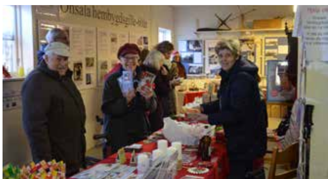
Bland julmarknadens utställare kunde man hitta allt från krämer till presentartiklar.