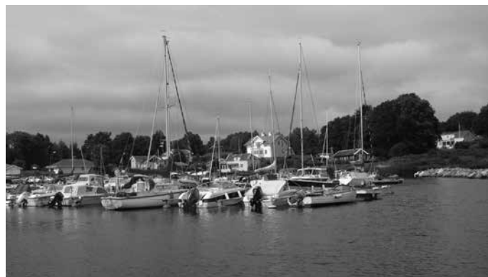
Stora Enen 2000-talet.