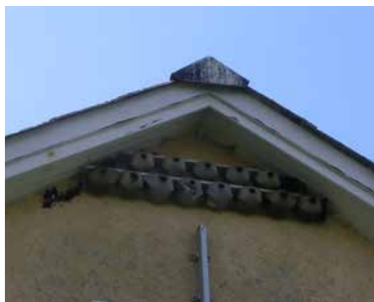
Här bor det svalor ute på Nidingen.