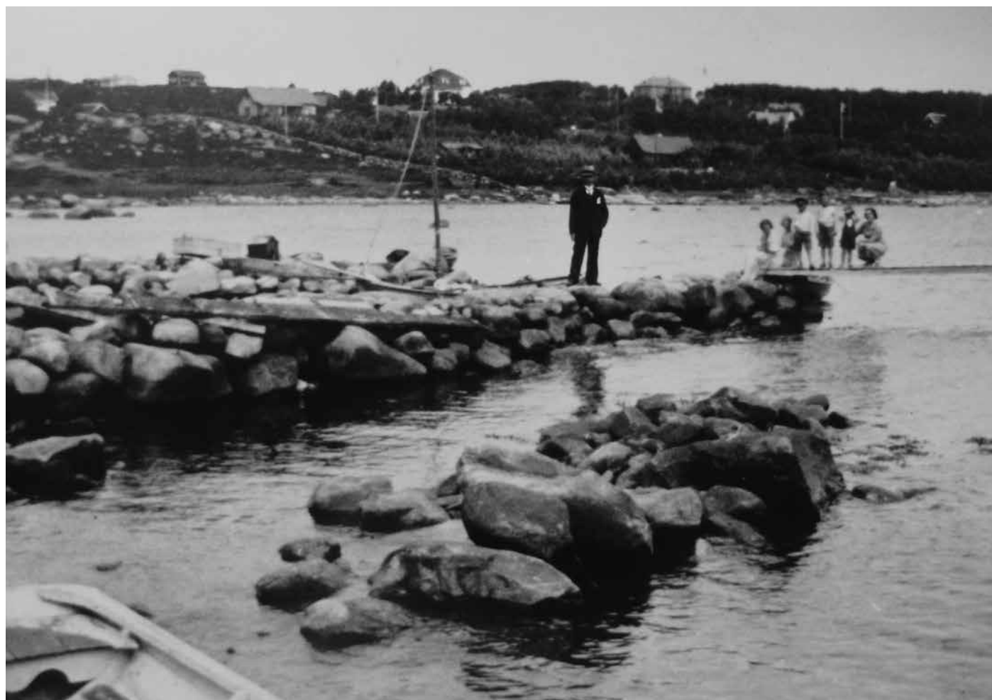
Stora Enen på tidigt 1900-tal.