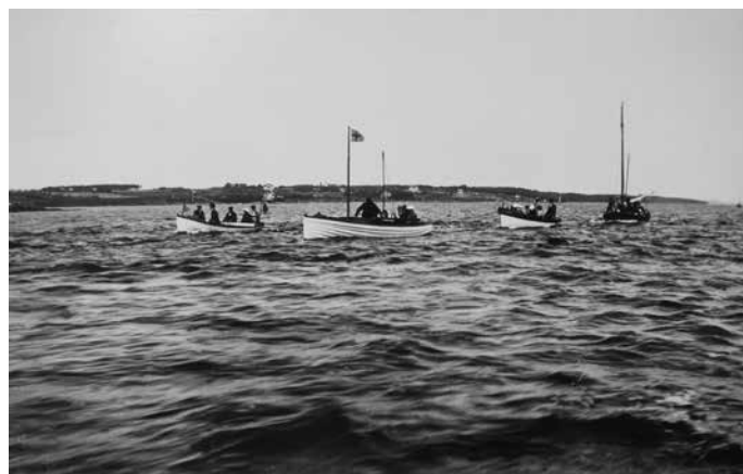
Tidig båtutflykt på fjorden.