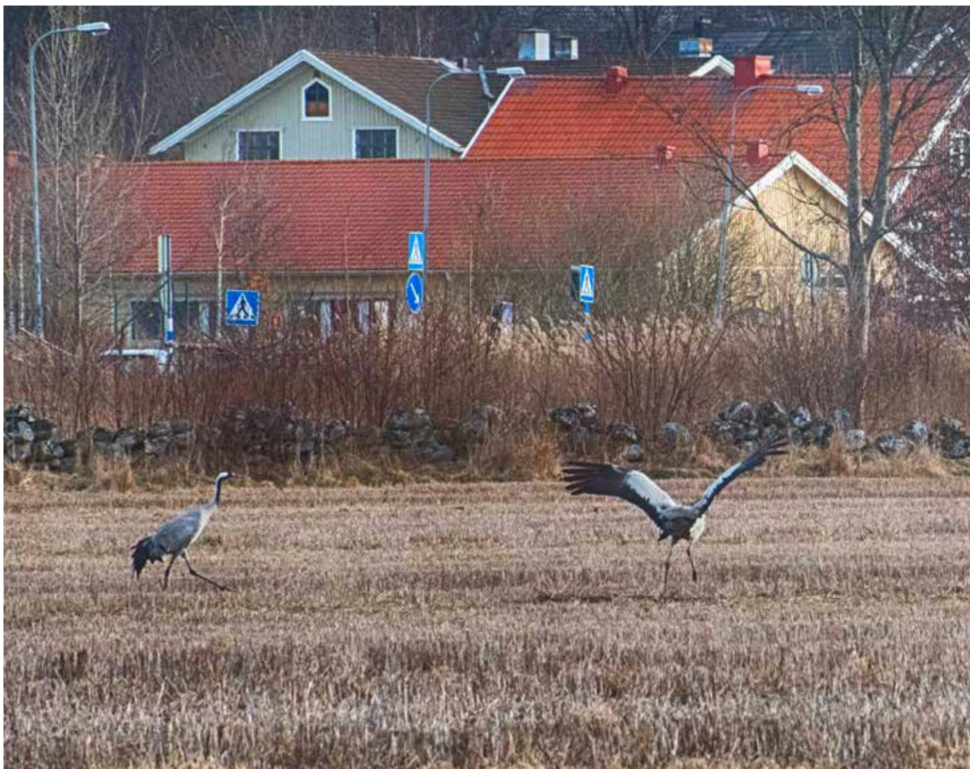
Tranor på ängen mitt emot Mariedals lanthandel. Antalet häckande tranor i Onsala har ökat de senaste åren.