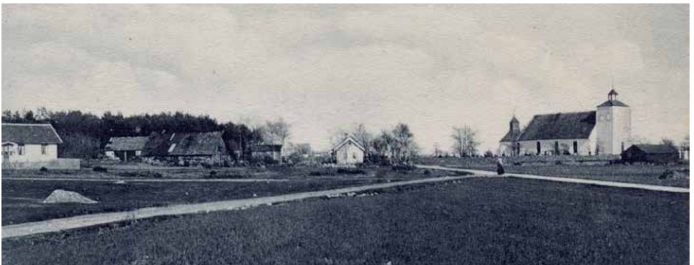
Fattigstugan låg i huset till vänster om det vita huset där man ser gaveln. Detta hus finns fortfarande kvar.

Onsala fattiggård såldes 1914 då kommunalstämman hade beslutat att fattiggården skulle ersättas av ett kommunalt ålderdomshem med 12 vårdplatser. Detta i anslutning till att all rotegång blivit förbjuden 1918 och att fattigstugorna blev ersatta med ålderdomshem. Hemmen skulle ge åldringarna den hjälp och vård de behövde. Det organiserades också öppen åldringsvård s.k. hemtjänst genom hemvårdarinnor och hemsamariter. 1961 byggdes ålderdomshemmet ut och vårdplatserna ökades till 16 stycken.