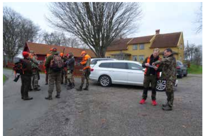
Strax före avmarsch till jaktpassen.