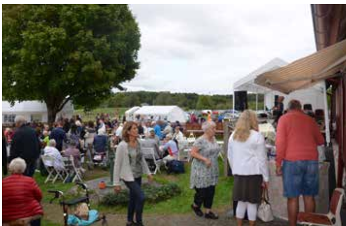
I vimlet på Apelrödsdagen där många besökare och utställare hade samlats.