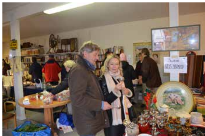
Välbesökt julmarknad med adventskaffe på Apelröd.