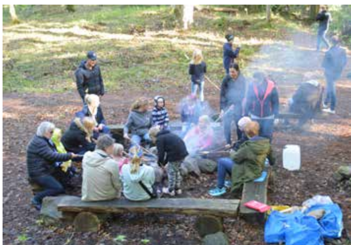
Pinnbrödstationen, Naturdagen, Mårtaskogen.

Facebook: https://www.facebook.com/friluftsförbundetonsala