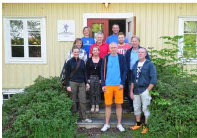
Styrelsemedlemmar 2018.