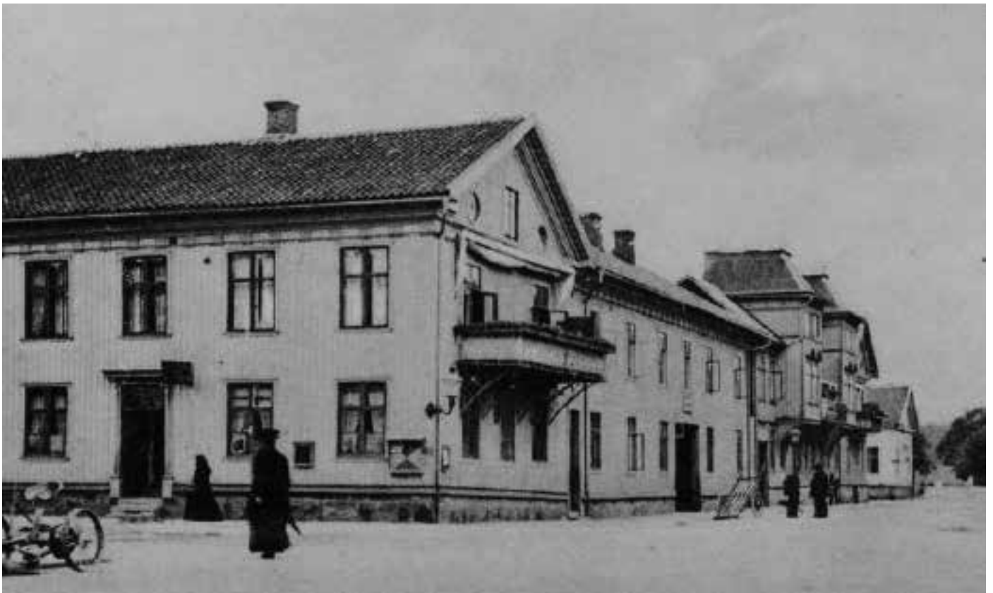
Kungsbackas första sjukstuga på Vallgatan 4. (Bild från korsningen Vallgatan-Storgatan ca 1910)