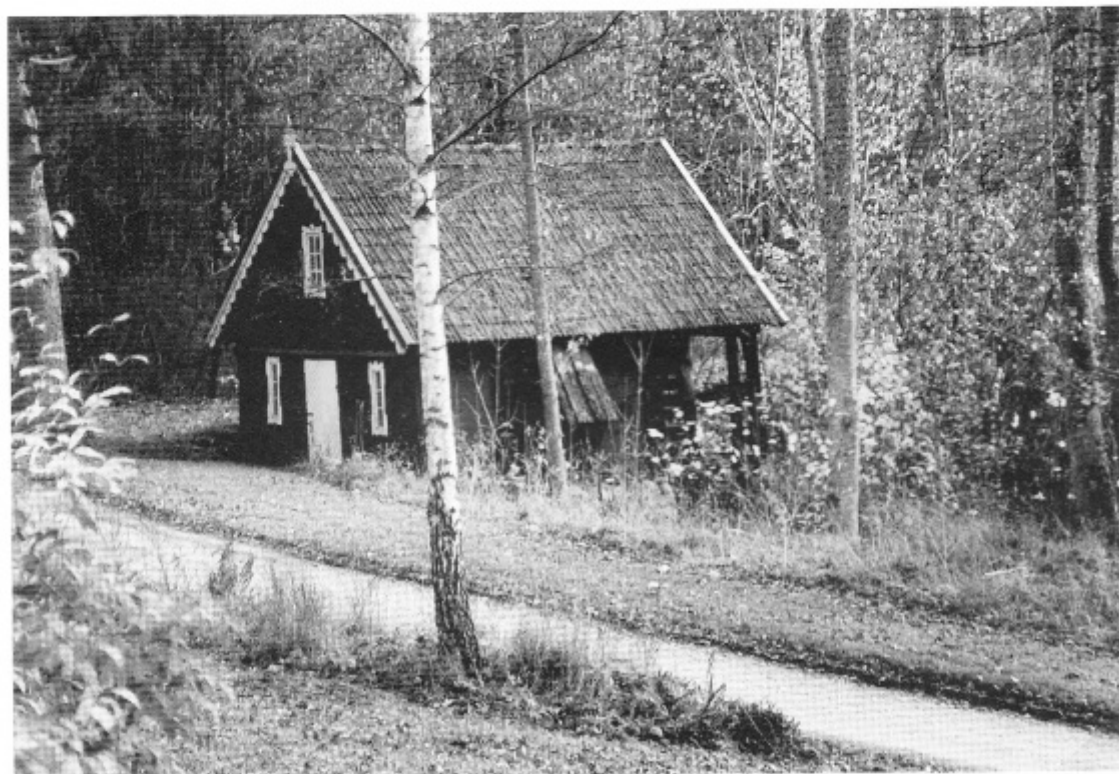
Mjönäs kvarn.

Vid tidig ålder fick man höra berättas om ”den hemska olyckan i Mjönäs kvarn”, där en mjölnare skulle ha klämts ihjäl. Blodfläckarna i taket skulle ha funnits kvar långt efter händelsen. Min skolväg till, som vi kallade den, mellanskolan, gick förbi kvarnen, och visst hände det att man tittade efter blodfläckarna i taket när man passerade. Men ingen visste med säkerhet när olyckan skett eller hur det hade gått till.