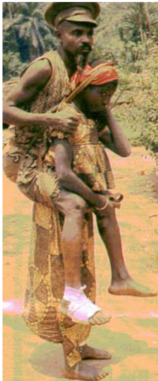
En annan "ambulans" i Pinga. Både män och kvinnor tjänade en slant på att fungera som bärare av de sjuka.

Vid kaffet berättar hon vidare om den första tiden i den lilla afrikanska byn Pinga.