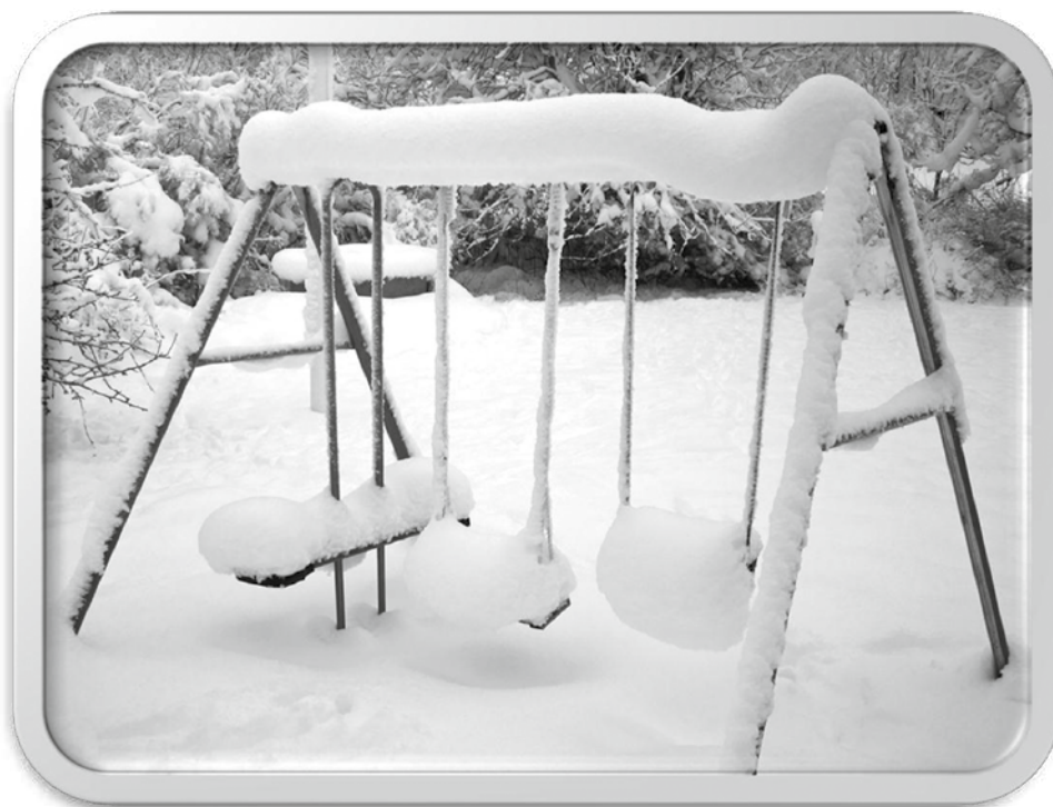
Vinter i Björsäter.