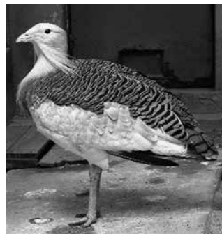
Trappfågel.

Hvarken den lyckliga skytten eller hans omgivning hade den ringaste aning om värdet av det gjorda fyndet utan antogs det först att foglen vore en trana. En bildad man boende i trakten fick emellertid kort efter händelsen reda på att en ovanlig fogel blifvit skjuten vid ovan nämnda ställe. Han ditskickade då planscherna till Svenska Foglarne af Sundevall och med ledning af dessa blef det klart att den förmenta tranan var en trapphona hvarefter den strax plockades och stektes. De på ort och ställe kvarvarande fragmenterna, näbb, ben, vingpennor hafva bekräftat den sista artbestämningen. Fogeln var verklig en trapphona som hade vägt 10 ½ Lp.