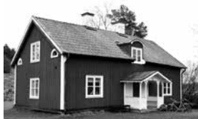
Gamla Hemmet byggdes 1856 och var från början ett fattighus.

Det dröjer inte länge förrän de första deltagarna kommer tillbaka från tipspromenaden. De kliver in i rummet och knäpper upp ytterkläderna. Sedan köper de varsin kopp kaffe och sätter sig runt borden för att diskutera frågorna. Men de pratar även om planerna för den nya hembygdsgården Gamla Hemmet.