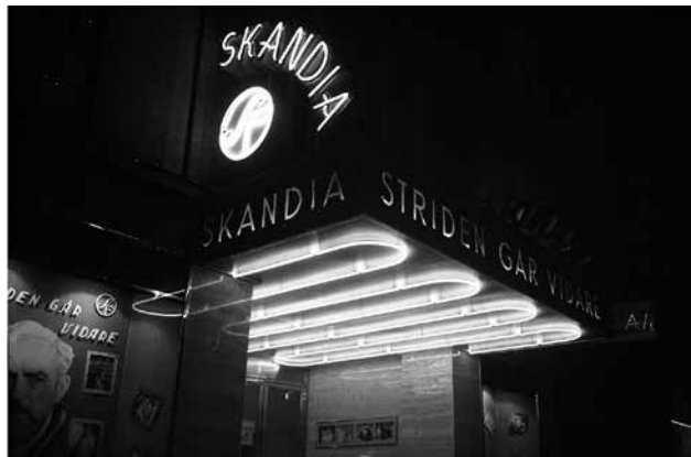
Gustaf Molanders Striden går vidare hade premiär på Skandia 1941.

På 1910-talet fick biograferna namn som man lånade från Paris biografier. Exempel på sådana namn är Röda Kvarn. Men det kom också att bli populärt med namn som anspelade på nationalromantiken, såsom Skandia, Göta och Svea. Från slutet av 1920-talet och framför allt under 1930-40-talen blev namn som vi annars associerar med eleganta hotell populära, såsom Aveny, Grand och Royal.