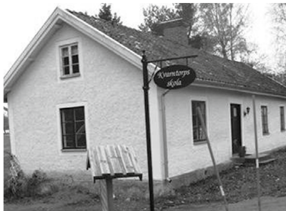
Kvarntorps skola redo för aktiviteter.