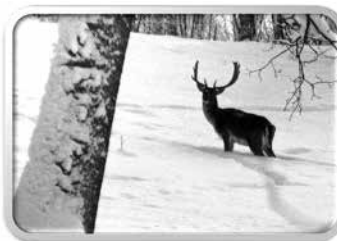
Hjort i vinterlandskap.

Välkommen med bidrag och foton. Materialet skickas till kansliet. Redaktionen förbehåller sig rätten att redigera texter och bilder.