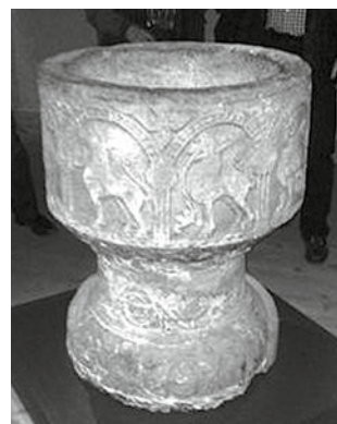
Bestiariusdopfunten i sin prakt.

Denna ”önskehelg” är planerad att återkomma vartannat år och den kan rekommenderas.