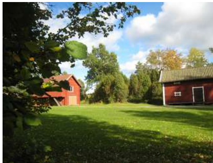
Här planeras den nya scenen att byggas.