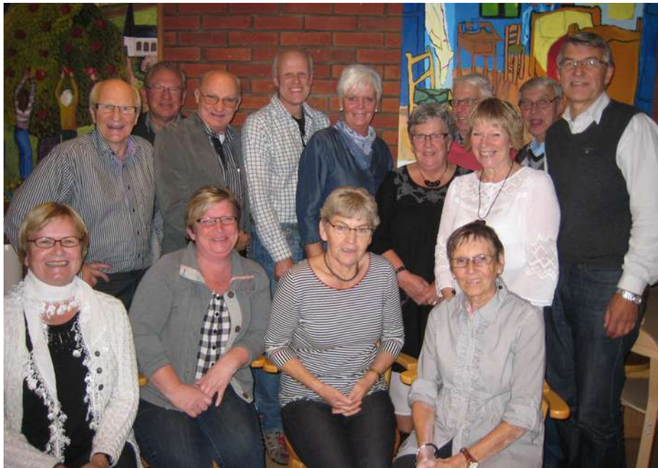
Styrelsen samlad 20110921