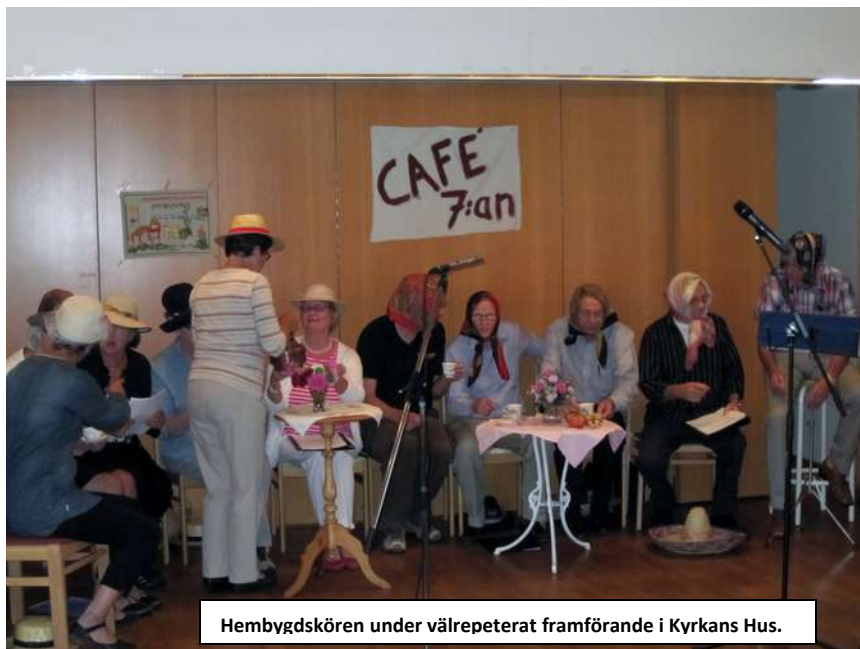
Hembygdskören under välrepeterat framförande i Kyrkans Hus.