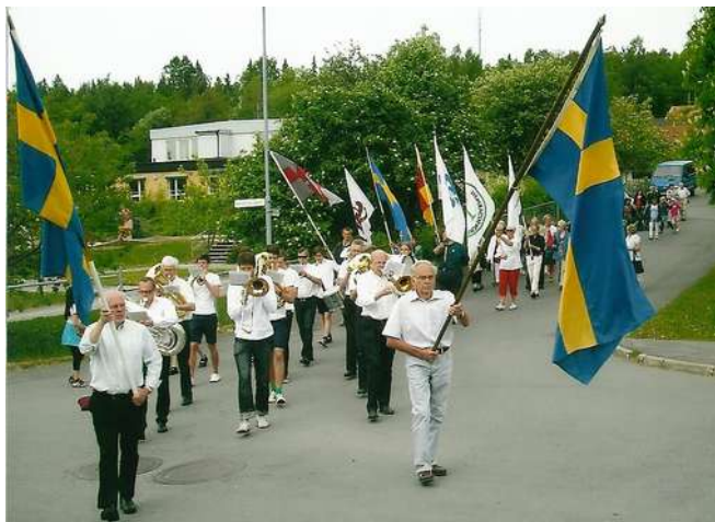
Med svenska flaggor i tåten tågas mot Mickelplan.