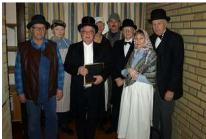
Teatergruppen spelar Husförhöret