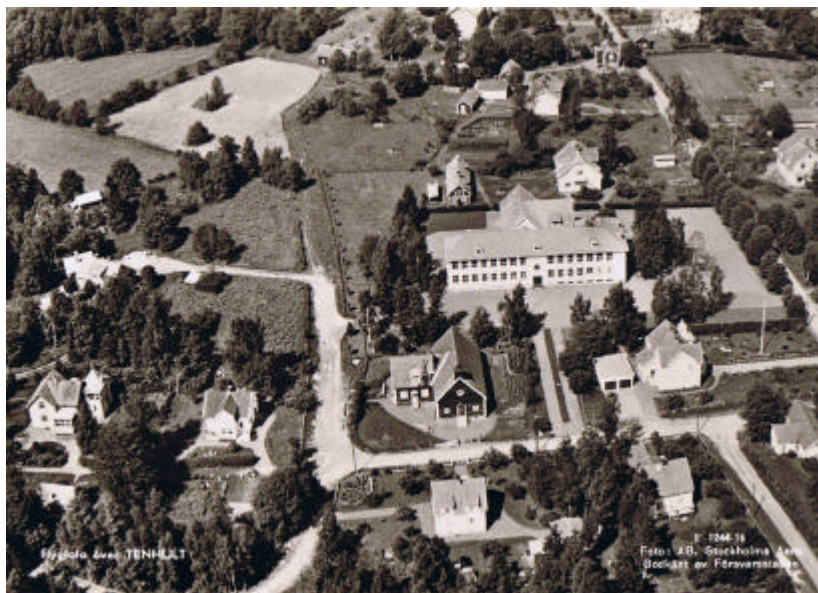
Tenhult från ovan 1949, nya skolan nyss invigd.