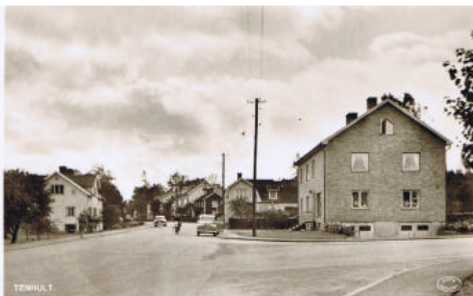
En bekant vy när det fortfarande kördes vänstertrafik och flera av de "gamla" husen stod kvar i centrum.