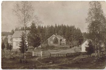
Graneborg och Hagaberg på en bild från c:a 1910

Efter sedvanliga årsmötesförhandlingar med parentation över medlemmar som under verksamhetsåret avlidit bjöds kaffe med hembakat, som sig bör! Som underhållare medverkade Ingemar Ström med bilder och berättelser om Tenhult under tidigt 1900-tal och under hans uppväxt som barn och tonåring. C:a 150 medlemmar och gäster besökte årsmötet.