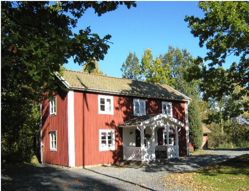
Hembydsgården en solig dag 2009.