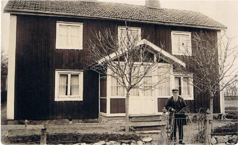
Björkudden, tidigt 1900-tal, i Centrala Tenhult