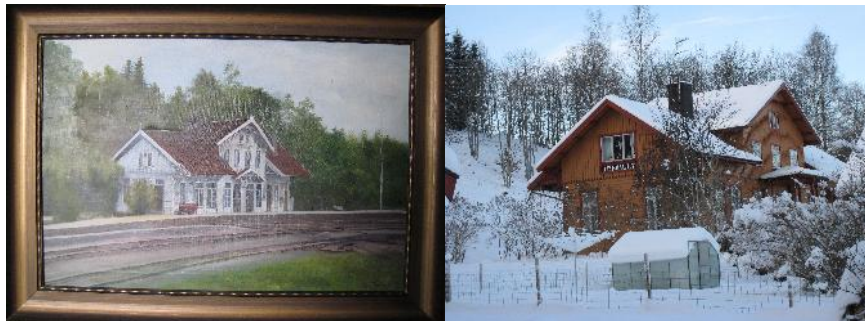
Tavlan från c:a 1925