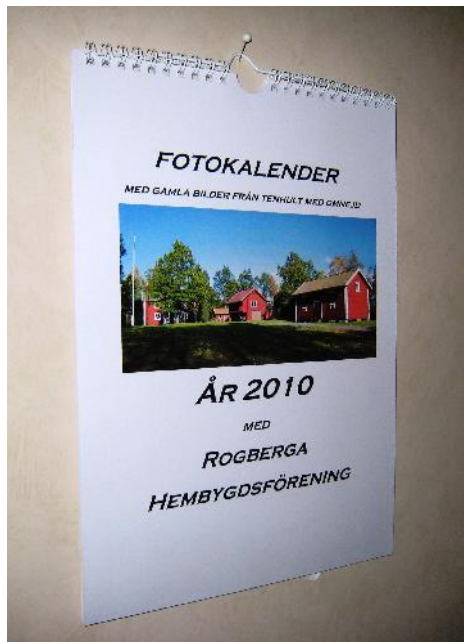
Foto-kalendern, som trycktes för att bli ett minne med bilder som kan bevaras, gick hem hos Tenhultsborna i den omfattning vi hoppades. Vi lär av detta till nästa gång, för fler kalendrar blir det, var så säker!

Till fantastisk hornmusik gladdes alla när "Trådrolla-bläcket" blåste ut!