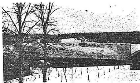
Stall o. ladugård samt en del av fruktträdgården

W. avlade stud.-ex. 1912, officer vid Skånska Dragonreg. 1917, ryttmäst. i Kav. res., placering vid K i 1943. Han är ordf. i komm.-fullm., komm.-stämman, led. av komm.-n., nämndeman från 1946, ordf. i skolstyr. 1938-43 m. fl. uppdrag.