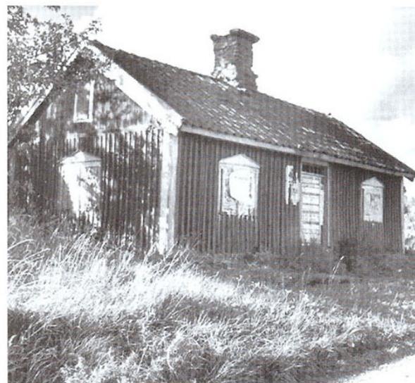
Enebylöt från 1930-talet.

På karta år 1677 finns ett torp Löthen markerat. Detta låg då norr om vägen till Löfsund (se markering på kartan). Torpet finns ej med i kyrkböckerna under senare delen av 1700-talet, vilket betyder att det var nedlagt då till i början av 1800-talet.