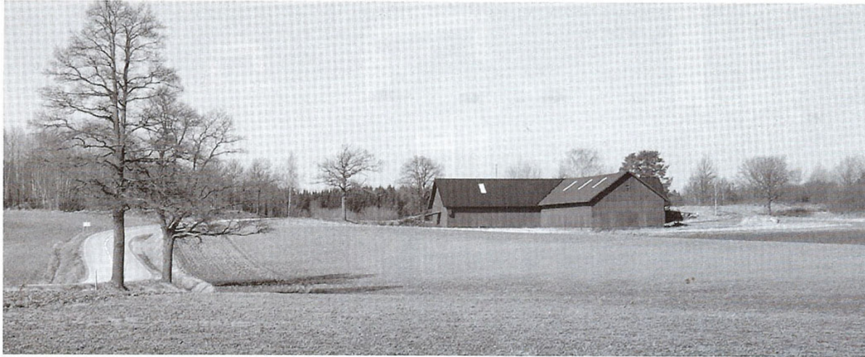
På kullen ovanför förrådsbyggnaden har byn Eneby funnits. Till vänster syns väg 223 mot Gnesta. Fotot taget från Löfsundsvägen. Foto Staffan Folke år 2004.