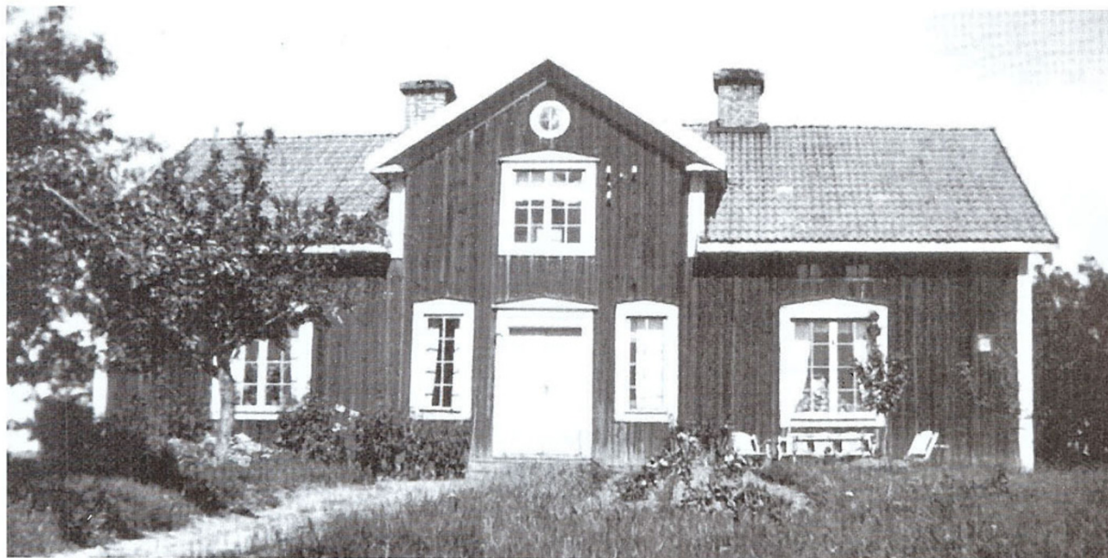
Sista gårdshuset på Eneby omkring år 1950. Det innehöll två lägenheter på nedre botten och ett rum ovanpå. Huset var bebott till år 1954 och brändes ned i början av 1960-talet.