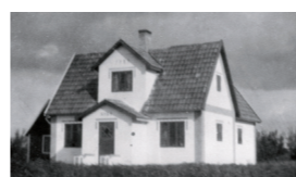
Kaptenens hus i allén.