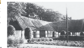
Gammelgården med vasstak.

Statarlängor där fastboende statare bodde var Scoutstugan, Sjöhuset och Krokahuset. Sjöhuset hyste tre statarfamiljer och Krokahuset tre familjer fram till det brann 1923. Det återuppbyggdes 1930 och då hyste det bara två familjer.