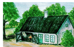
Smedjan vid Rydebäcks allé, målade av Elna Malmros.

Rydebäcks allé kantades ursprungligen av almar och följde den nuvarande sträckningen från Rydebäcks gård till Rya by. Den passerade Krokahuset som tidigare var arbetarbostad för tre familjer.