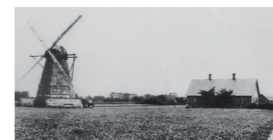
Postkort: Rydebäcks kvarn

Slaktarens hus finns kvar idag på södra sidan längs allén mitt emot platsen där gårdsgården vek sig norrut.