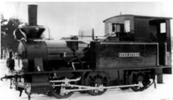
Loket nr. 3 "Sten Sture".

Posten lästes upp högt av Olle. Kom det ett vykort till någon nära eller fjärran ifrån så lästes texten också upp. Sedan kunde man ha samtalsämne en god stund om var denna plats var belägen på jordklotet och vem eller vilka som rest dit. Likaså visste alla allt om politisk resp. trosåskådning hos sina grannar. Det utvisade ju deras tidningar.