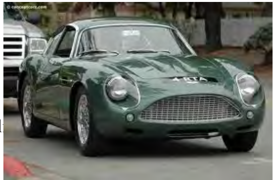
Aston Martin DB4 GT Zagato

alla mina pengar till bilen och tävlingarna. Detta ångrar jag verkligen inte - jag hade mycket roligt och lärde mig massor. Samtidigt måste jag erkänna att pengarna kunde ha investerats på andra sätt. Det svider fortfarande när jag tänker på den Aston Martin Zagato, som jag som 20-åring INTE köpte. Då kostade den 12 år gamla bilen 30 000 kr. Nyligen såldes den på auktion i England för 35 miljoner kronor.