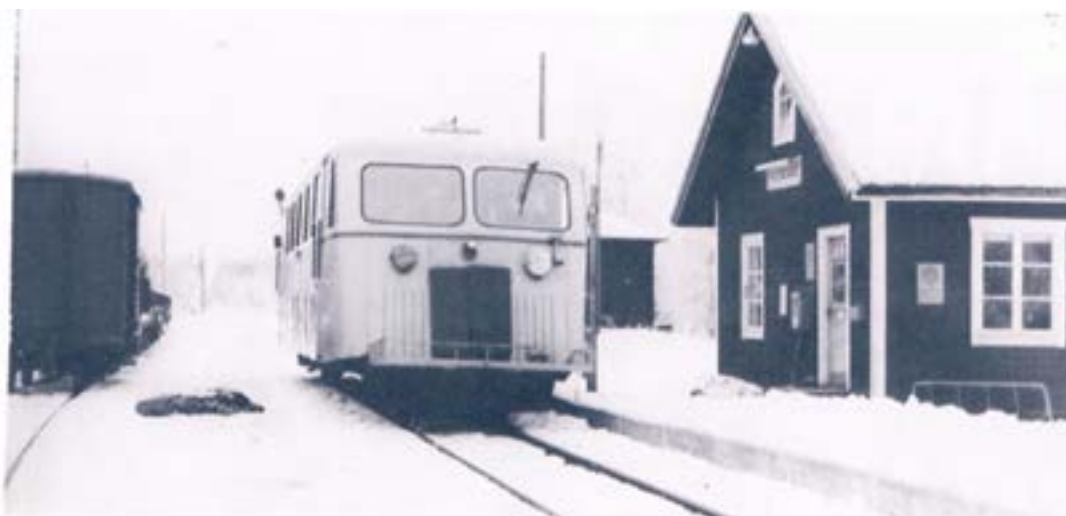
Ovan: Tidtabell 1930 Nedan: Rålsbussen 22.1.1961 troligen vid Hultagårds station