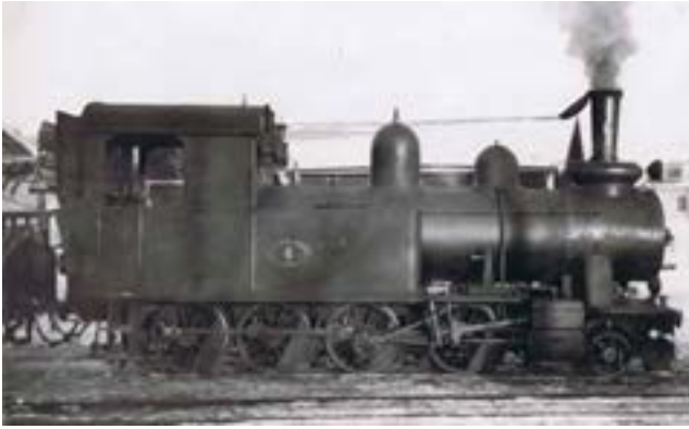
Vetlanda J. Lok nr 6. Tillv Motala Verkstad år 1910.

1952 flyttade vi från Ö. Järnvägsgatan 34 till Eksjöhovgårdsvägen och lämnade på