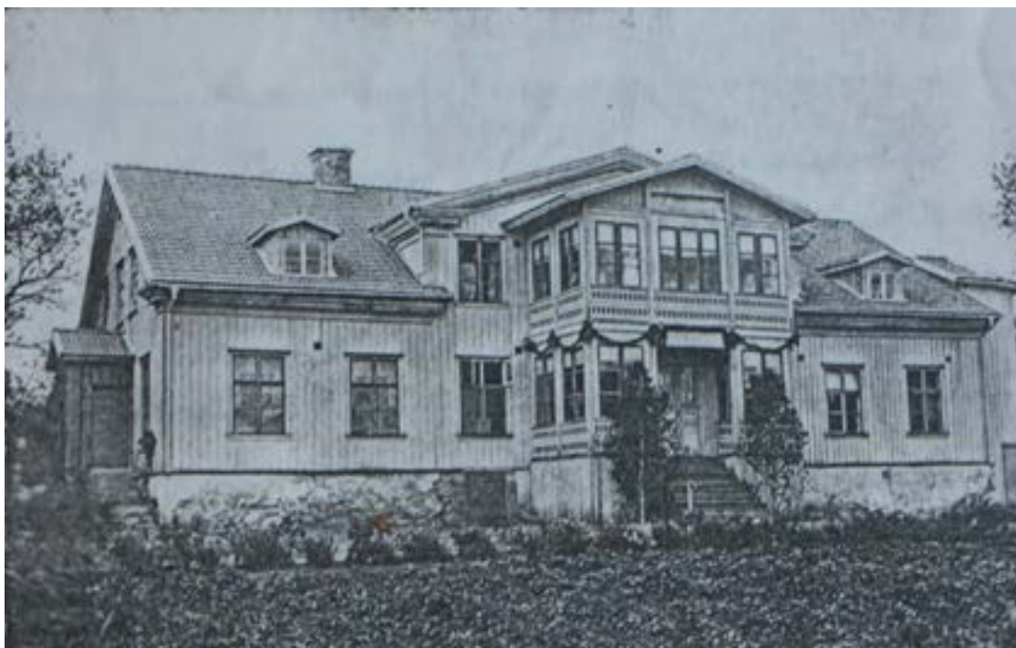
Huvudbyggnaden under 1920-talet