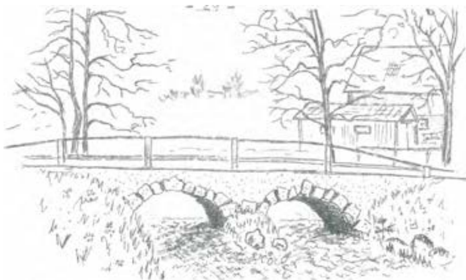
Brön vid Kistegård.