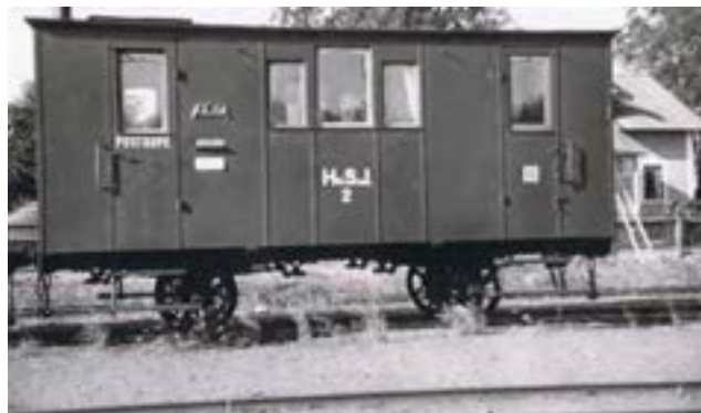
Kombinerad III klass och postvagn.

På 1950-talet åkte jag varje dag i 4 års tid, utom under loven, tur- och retur med sagda buss till Sävsjö och realskolan där. Jag kan inte minnas utan att ”Bocken” gick punktligt hur mycket snö det än kommit under natten. Tyst gick den också, underligt men jag tror aldrig att det skedde någon olycka på den sträckan, ändå korsade flera obevakade övergångar järnvägen.