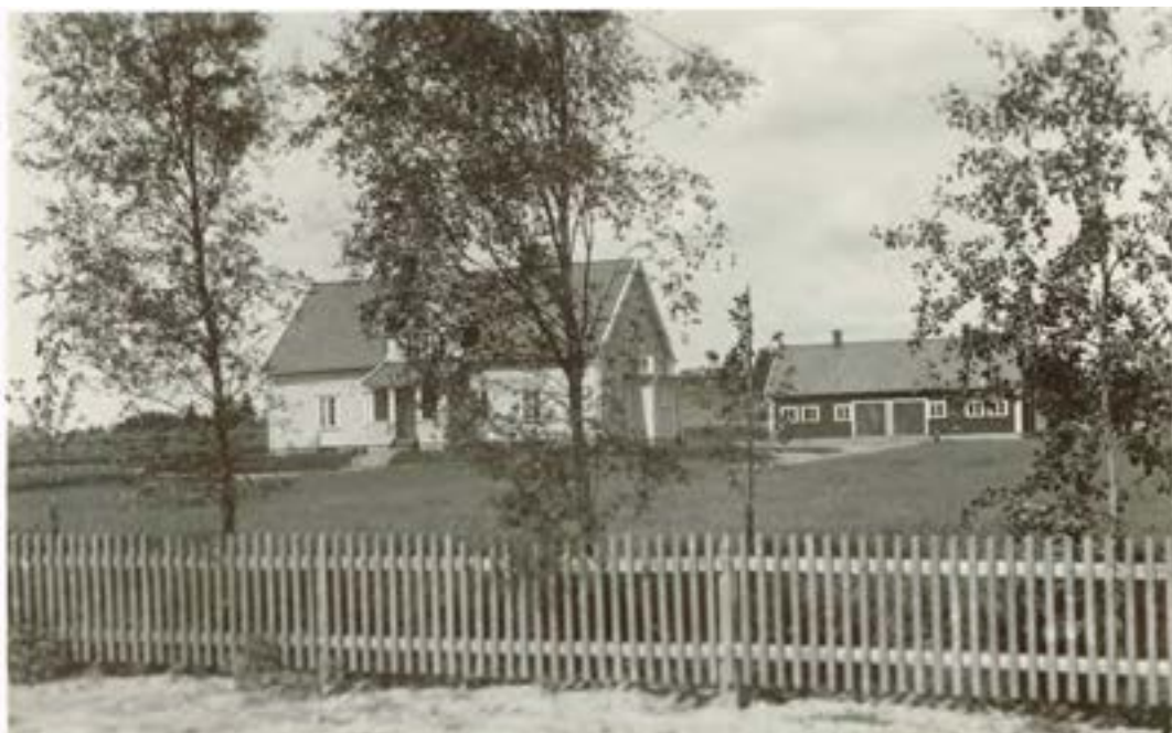
Vallsjö prästgård, byggd 1925.

Den 12 augusti 1930 om eftermiddagen stod en taxi från Blooms åkeri i Sävsjö och väntade på Ölandskajen i Kalmar.