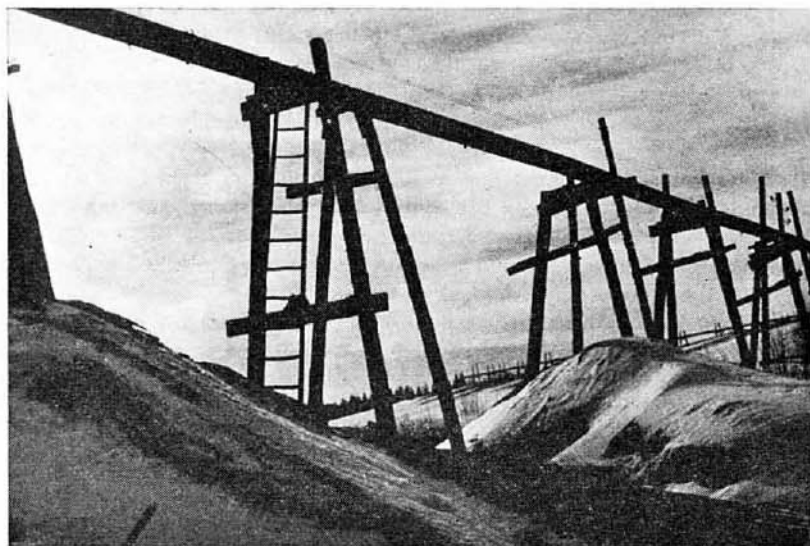
Kantorp: motiv från gruvdammen