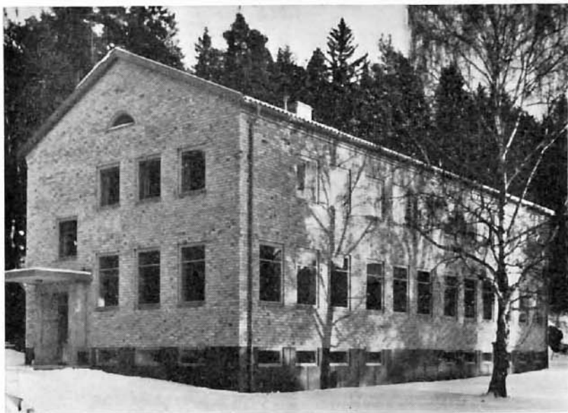
Åsa folkhögskola: nya skolhuset