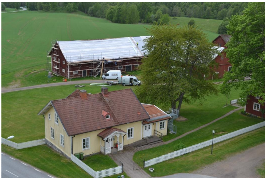
I miljön kring Snavlunda kyrka finns kyrkans f.d. arrendegård. Boningshuset i förgrunden utgör numera Snavlunda Församlingsgård medan lagården i bakgrunden används av Snavlunda hembygdsförening. Det är vänstra delen av denna byggnad som nu fått nytt tak.

Den aktuella ladugården utgörs av en faluröd vinkelbyggd länga. Västra delen av den östvästliga längan har innehållit stall med höskulle ovanför och den östra delen lagård. Den nord-sydliga längan har varit loge. Byggnaderna är delvis hopbyggda i det sydvästra hörnet.