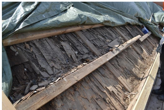
Upptill: Stickspånen var i dåligt skick. Här och var syntes lagningar, där spånen var bättre. Mitten: Där stickspån saknades skedde komplettering. Ny läkt spikades. Nertill: Spånen på norra takfallet.