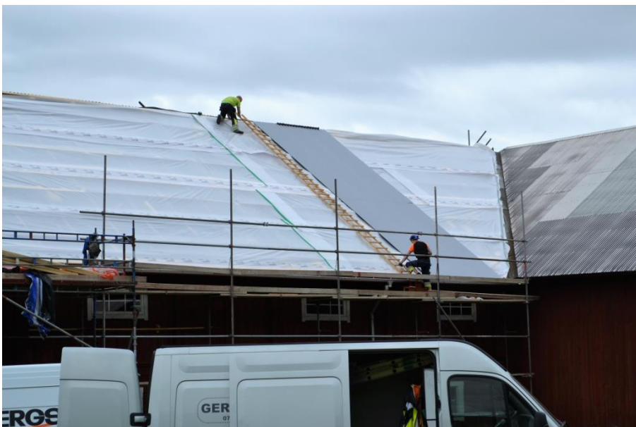
Upptill: Snickarna bär upp de nya takplåtarna på taket. Mitten: Montering av de nya plåtarna. Nertill: Taket under montering av plåtarna.