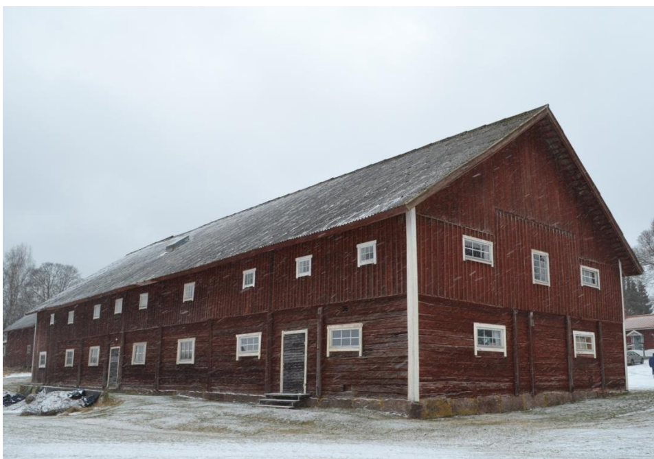
Upptill: Den aktuella ladugården, där den vänstra delen innehållit stall och den högra loge. Ställningar är resta på stallet inför det förestående bytet av takmaterial. Foto från NO. Nertill: Stallet före arbetet. Foto från SO.