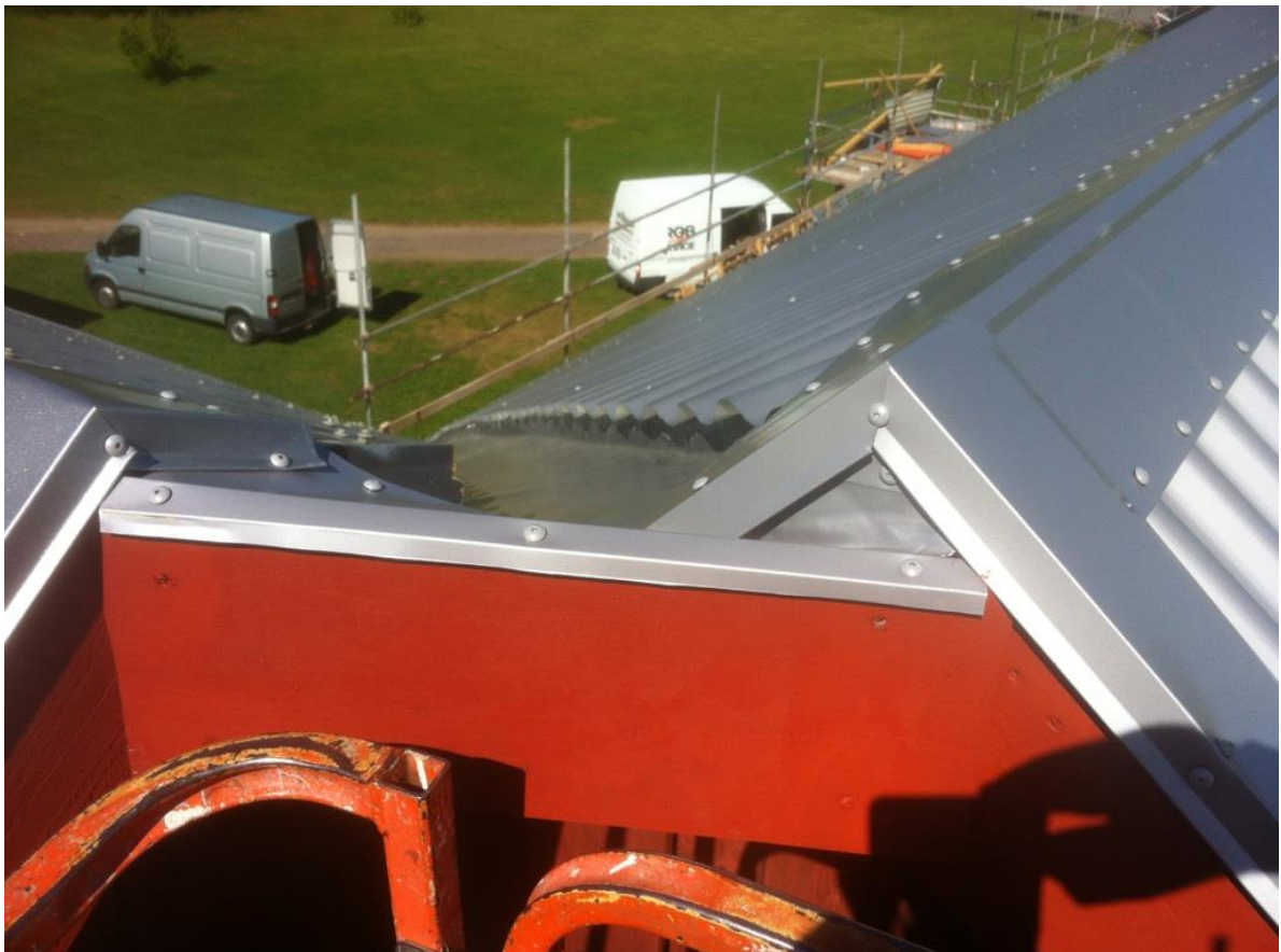
Nyanockplåtar och plåtbeslag monterades vid taknocken i mötet mellan logen t.v. och stallet t.h.