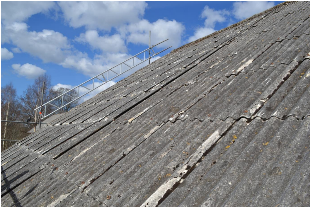
På den västligaste delen av byggnaden låg eternitplattorna lite "trångt". Det förklarades senare, när det visade sig att denna del av byggnaden var tillbyggd.

På den västligaste, tillbyggda delen av stallet fanns inget spåntak över huvud taget utan endast eternittaket.