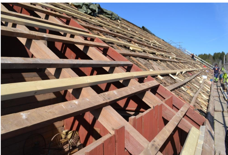
Upptill: Eternitplattorna var i dåligt skick. Mitten: Ventilationshuv / fönstret på södra takfallet togs bort. Nertill: Den västligaste tillbyggda delen av stallet hade aldrig varit täckt av stickspån utan här hade eternitplattorna lagts direkt.