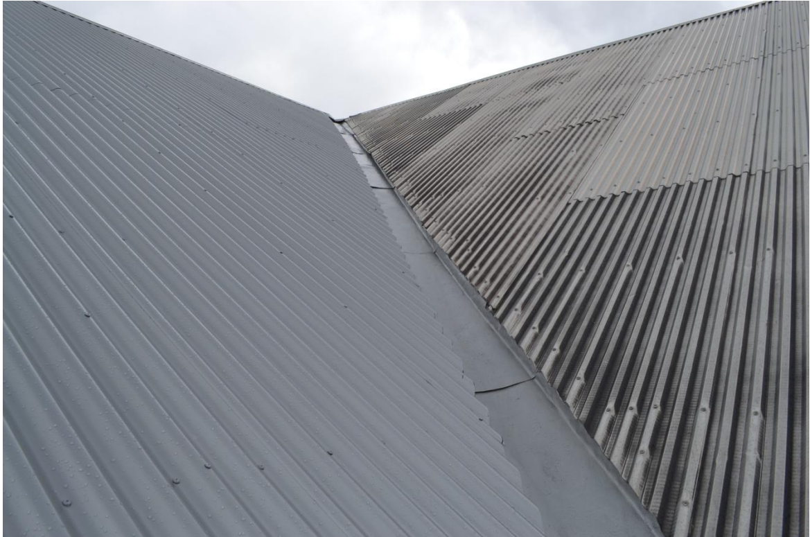
Ny rännadal monterades i vinkeln mellan stallet och logen.