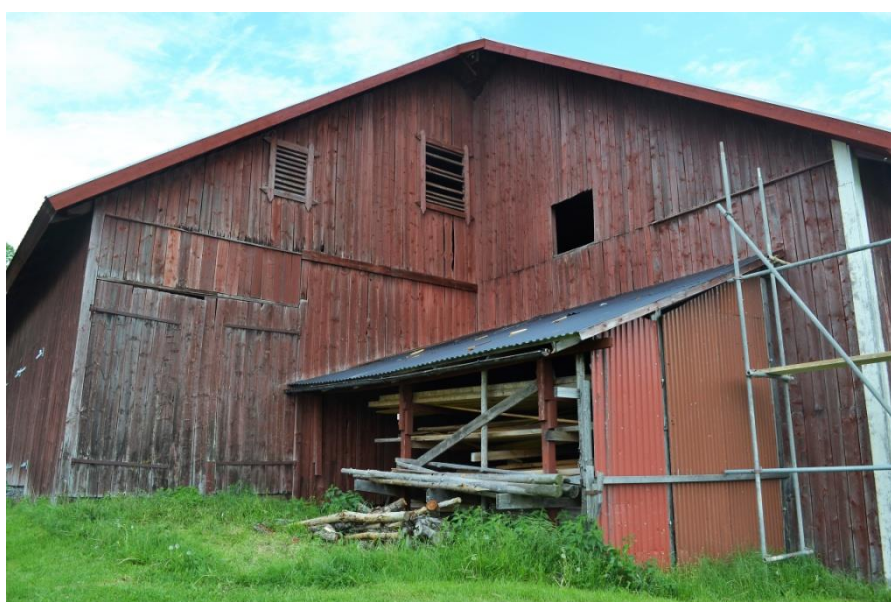
Uptill: Nya takfotsbräder sattes upp. Mitten: Takfoten på den tillbyggda västra delen av stallet kompletterades med brädfordring. Nertill: Båda gavlarna fick nya vindskivor, så även på logens sydgavel.