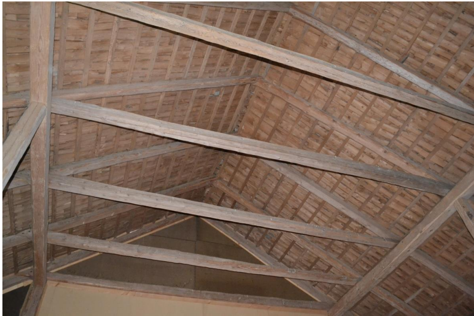
Upp till: Taket på stallet utgjordes av eternitplattor, lagda i slutet av 1960-talet. Nertill: Ursprungligen bestod taket av stickspån, vilket syns invändigt i byggnaden.