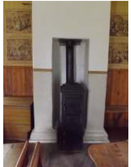
Värme för lokalen och delar av museet utomhus. Hur ser försäkringen ut egentligen?

Hembygdsförsäkringen, Östra Långgatan 30A, 432 41 Varberg hembygdsforsakringen@hembygd.se tfn 0200-22 00 5500