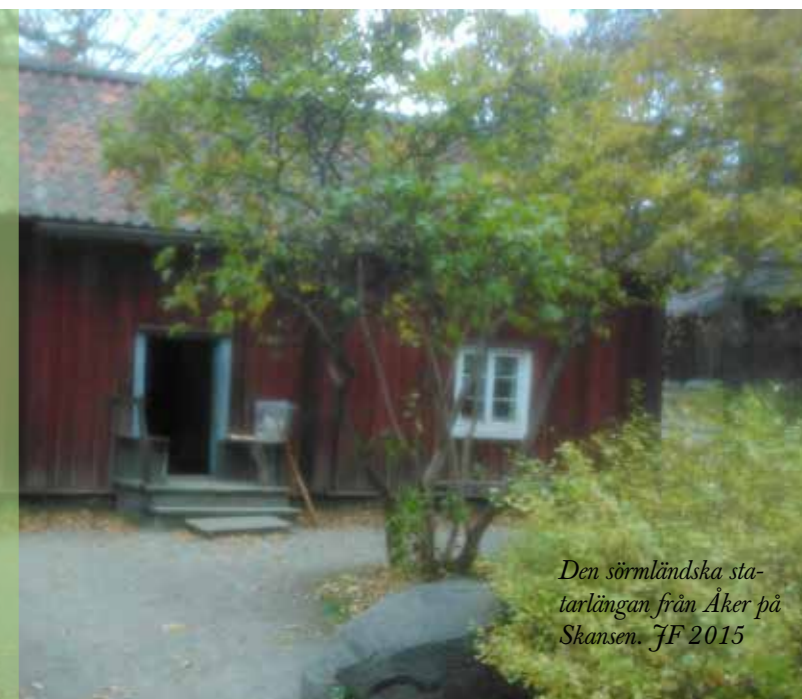
Den sörmländska stamtavlan från Åker på Skansen. JF 2015

Om bussbolaget är de som ordnar resan är det också de som tar emot deltagarnas betalningar.