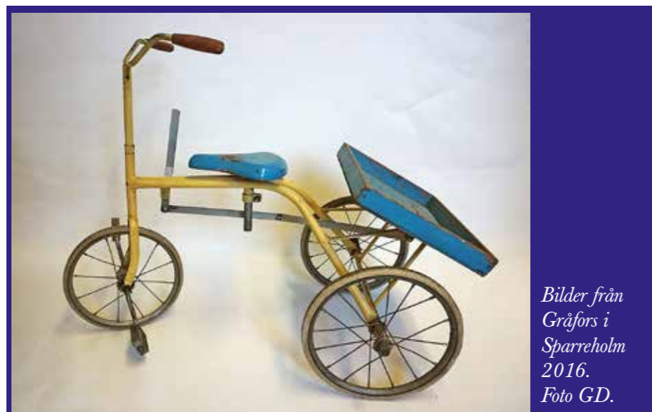
Bilder från Gråfors i Sparreholm 2016.

Förbundet har sökt ekonomiska bidrag för att göra denna utställning. Vissa har redan beviljats men svar från flera bidragsgivare väntas. Hur omfattande utställningen blir och i hur stor omfattning som professionell hjälp kan erhållas är givetvis beroende av ekonomin. Denna extra satsning är inte budgeterad utan måste bekostas av externa medel.