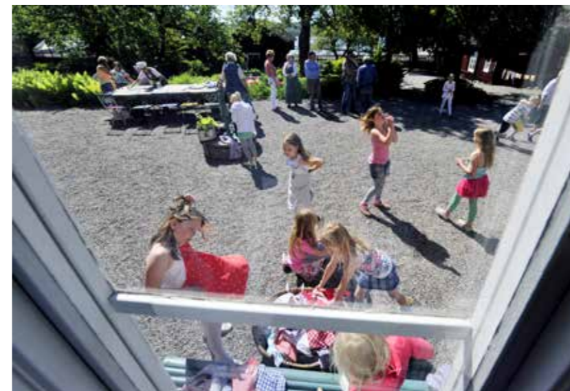
Bilden är från Callanderska gården 2009-2010.