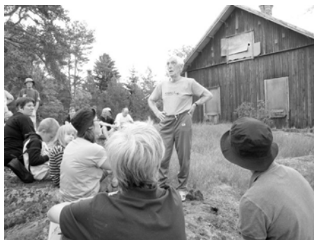
Evert berättade om IOGT-lokalen