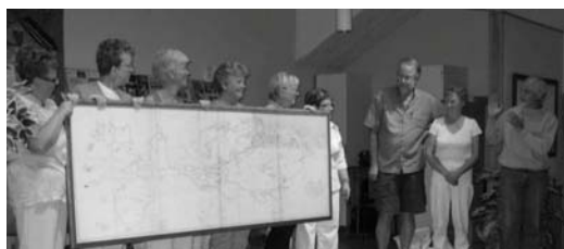
Kartan överlämnas

Vi vill passa på att lämna ut de rätta svaren på "gissa vad det här har använts till"-tävlingen. Det var många som engagerade sig i frågan vad det var för tre konstiga föremål som föreslades. Fantasin och kreativiteten flödade när man försökte komma på de rätta användningsområdena, men så här var det.