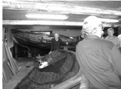
Byvandring Färdgärde - Hummeldal

En fiskare ifrån Färdgärde som en dag skulle vittja sin mjärde, drog ett sjöodjur opp och fick nästan en propp när det fråga: "Loch Ness är de här de"