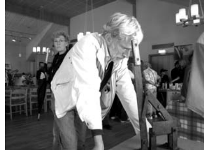
Söderödagen Funderingar över föremålen