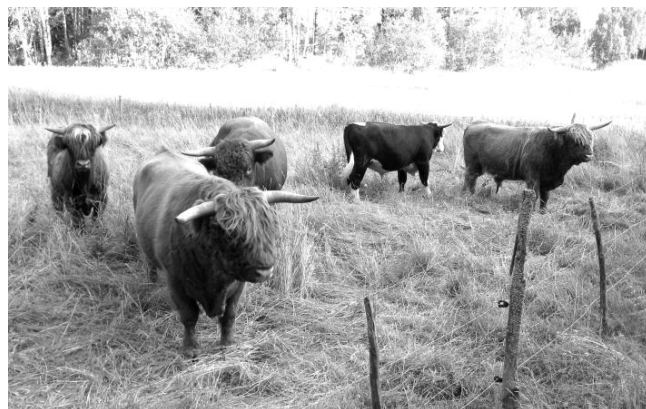
Sommarbild från Söderön, Highland Cattle vid Löparbacken