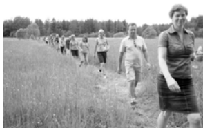
Vandring på rad

Vandringsleden är ett projekt som drivits av Upplandsstiftelsen och Upplandshägar.