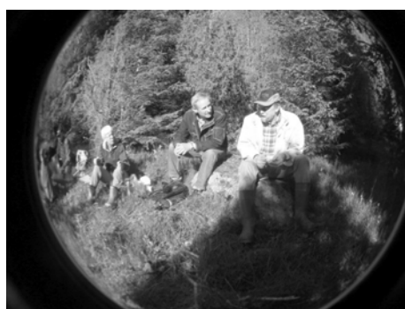
Göken tittade på oss?

Inte att förglömma fikastunden tillsammans med trevliga medlemmar i hembygdsföreningen.