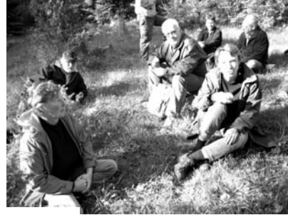
Gökotta fikarast