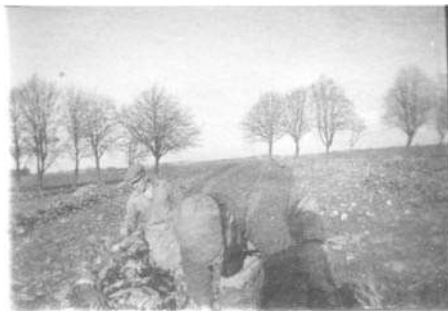
Här får man en uppfattning om de långa raderna.

Efter sex veckors jobb var alla betorna upptagna och vi fick vår avlöning av inspektören på godset och fri resa till Östhammar.