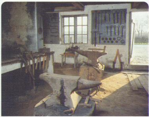
Interiör från Nevishögs smedja

Det gick inte helt enligt ritningarna, kyrkan fick hjälpa föreningen med köpet och först 1992 kunde föreningen glädja sig åt ett fullbordat köp och lagfart på fastigheten. Genom många goda krafter och många goda gåvors givare kunde så smedja och bostad säkras för eftervärlden och byggnaderna genomgå en nödvändig, pietetsfull restaurering.