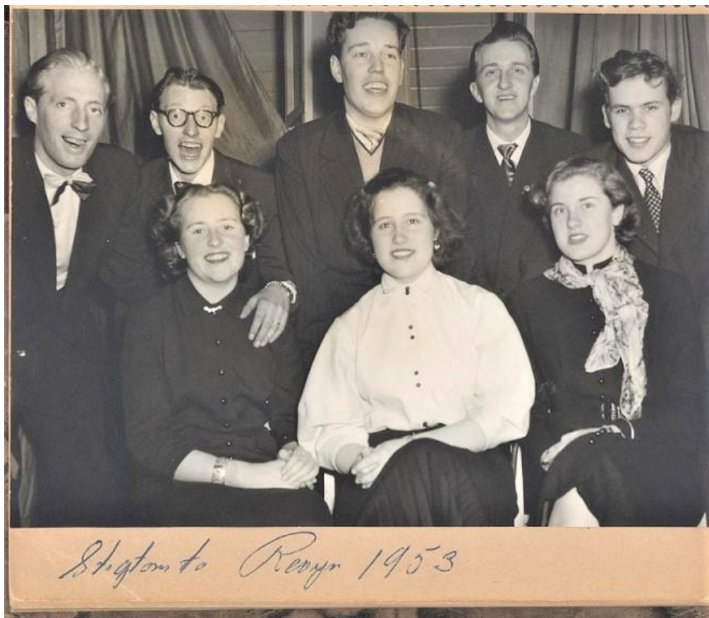
Stigtomta Revyn 1953, ett glatt gäng underhållare.

Skogshyddevägen - Nilsborgsvägen - Almnäsvägen