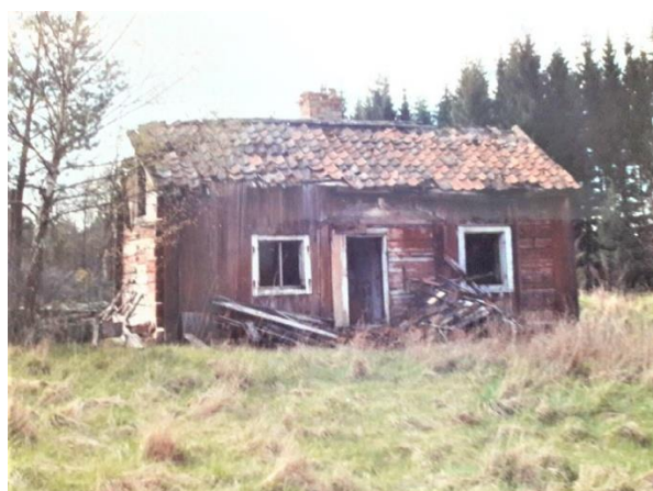
De kom ursprungligen från torpet Ingmässlan under Valinge. från ca 2005-2007. Nu rivet.