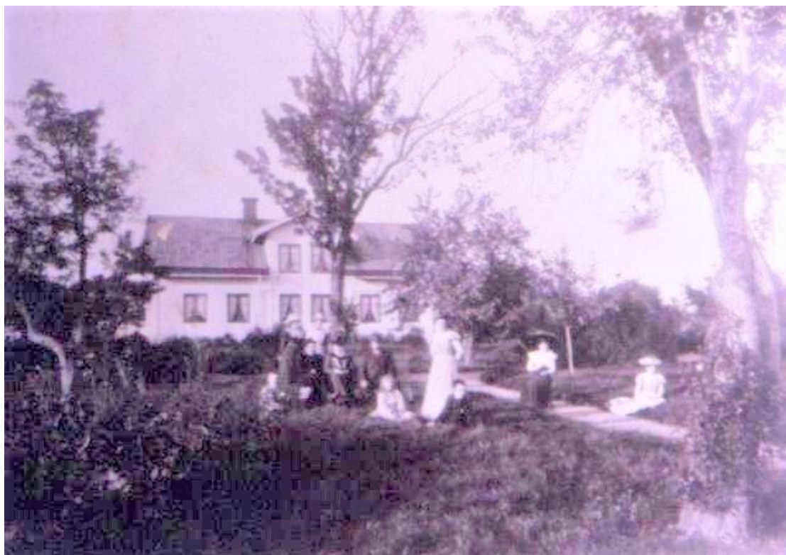
Tengsta, diabild ur Andréns samling, årtal okänt