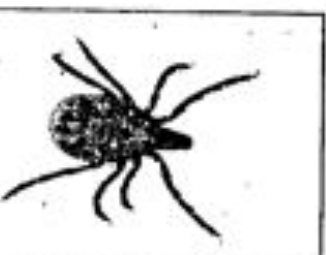
Av fjästa det vaccin mot virus som sprids av de här små krypen.

Symtomerna är feber och huvudvärk till nästan alla som