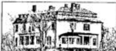
Huset som Peter Wallenberg vill riva.

Bygget som Wallenberg vill riva ska byggas på samma plats vid Brevlös gård, öst och Strindberg.