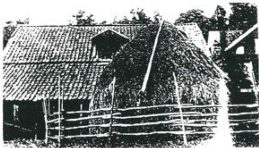
MALMA KVARN ca 1932