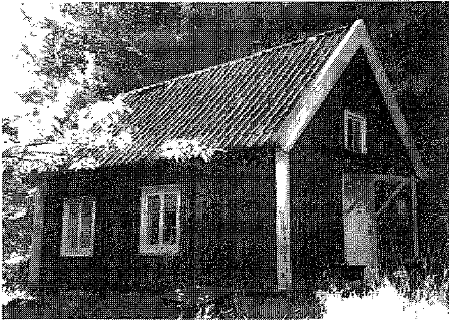
Korshamnstorpet sept. 2001

Troligen var marken längst in i Korshamnsviken, d v s det forna sundet mellan Malmaön och Fågelbrolandet, allt för sankt och vattensjukt för bebyggelse och odling före 1800-talet. De närmaste torpen Skepparviken och Tavastboda är betydligt äldre, nämnda i källor 1731 respektive 1680. Korshamnstorpets läge vid en skyddad vik är typiskt för skärgårdens torp och gårdar, en skyddad hamn var viktig då fisket hade stor betydelse för försörjningen.