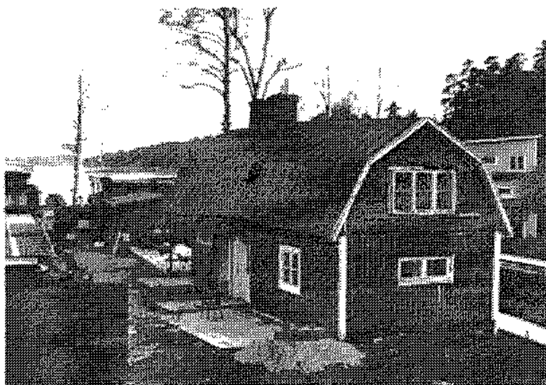
Kanaltorpet då renoveringen just börjat våren 2001.

Nu skulle det gamla torpet renoveras för att på nytt bli en åretrunkrog. Ny panel utvändigt och nya fönster var redan klart. Man hade nu påbörjat arbetet invändigt och innerväggarna var på väg upp. Krogrörelsen skulle ha startat igen till sommaren. En veranda hade redan påbörjats och platsen mellan husen skulle övertäckas och ett stort kök skulle byggas.