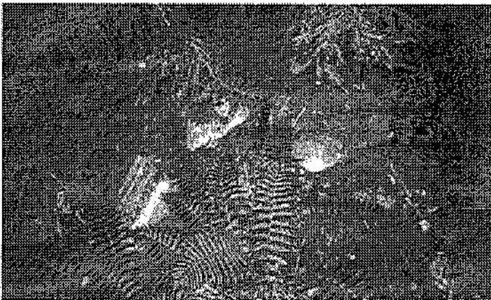
Grundrester funna vid Sågsjön

Detta är sista gången Sågen nämns i kyrkböckerna.