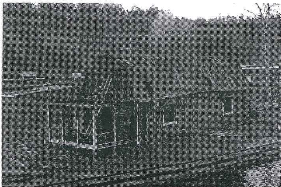
Kanaltorpet onsdag morgon den 14 nov. 2001

Skärgårdsborna, på väg till Stockholm för att sälja fisk