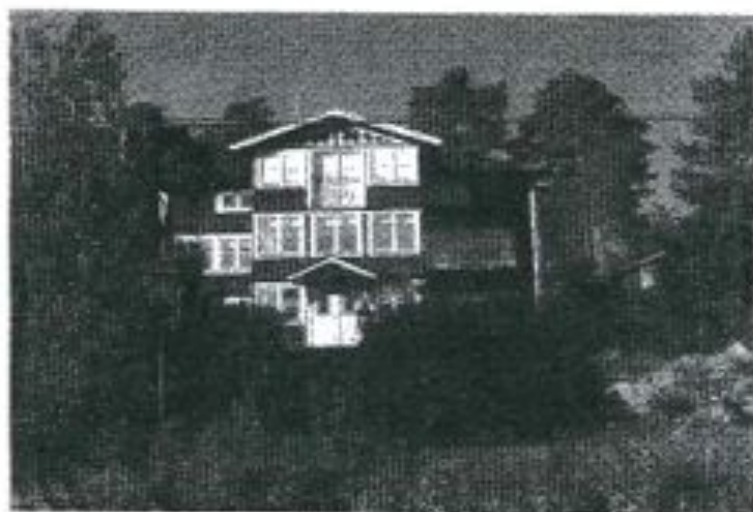
Strömma Gård Foto BM Ohlsson 2005.

Efter att detta skrivits har Strömma gård åter bytt ägare och huset har fått tillbaka snickarglädjen efter att man gjort en grundlig renovering.