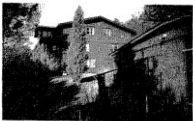
I byggnaden till höger i bild finns grundrester som troligen är från den gamla kvarnen.