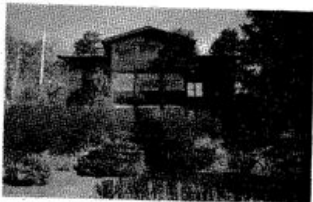
Strömma Gård sedd från Svanvägen. Foto BM Ohlsson 1998.