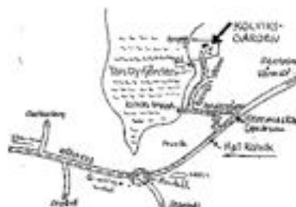
Skiss över området med tillfartsvägar

de anställda. Under 2004 har man alldeles vid stranden där man en gång lossade timmer byggt en mycket påkostad anläggning med bastu, duschar, vitrum och pentry med utsikt över Torsbyfjärden genom stora fönster.