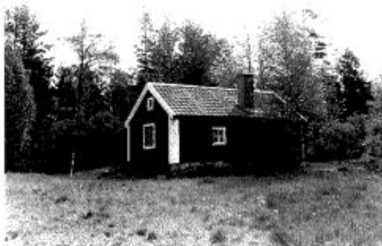
Torpet Andersdal 1985.