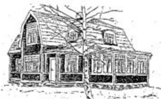
Stora villan, "Dispoentervillan"