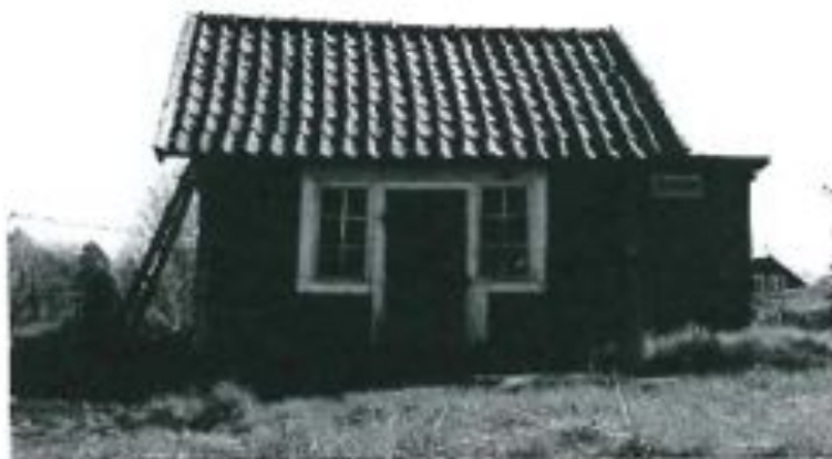
Bild: Gamla vvinhuset med dasset till höger.

Efter att vi fått vila benen en stund fortsatte vi genom ett litet skogsparti och kom ut på nästa äng. På en liten holme ute på ängen finns ytterligare rester av ett torp. Det kan vara torpet Nyeby som fanns tidigt på 1700-talet. Men, det är väldigt svårt att säkert veta vilket torp som är Västerdalen och vilket som är Nyeby, då de inte finns utsatta på 1800-talskartan.