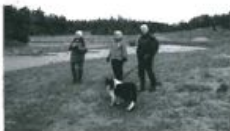
Britt-Marie, Ulla och Johan med Mack.

Först passerades Korpberget, som majestätiskt tornar upp sin välvda breddside mot gångvägen. Hasselsnår kantar längs hela basen av berget som med sin urgröpting av inlandsisen säkerligen givit många människor och djur skydd för väder och vind genom århundraden.