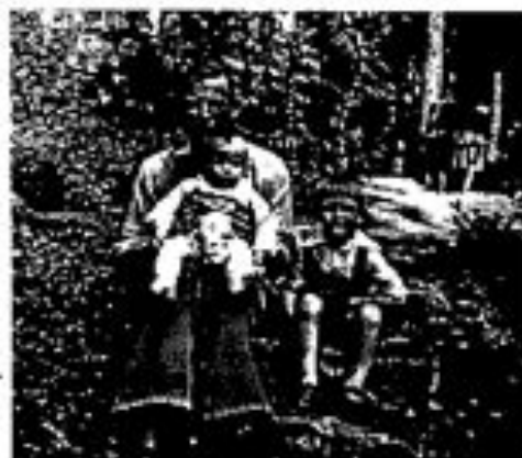
Bild : Författaren av detta dokument med yngre bror och får.