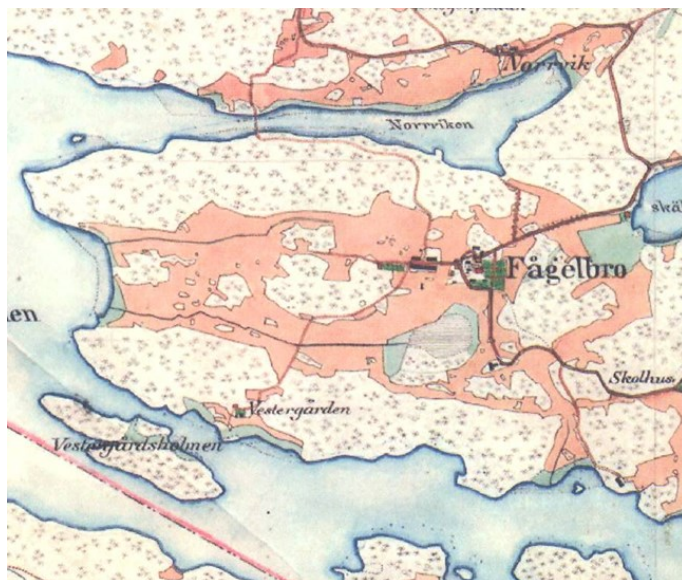
Västergården på karta från 1800-talets senare del.

D är Skenoraströmmen, som skiljer Ingarö och Fågelbrolandet, möter Tranaröfjärden, ligger Västergården. Eller Fogelbro Torp, som den hette fram till 1770-talet. Det ursprungliga torpet, vars grund ännu står kvar, var ett timmerhus, uppfört på en stengrund med matkällare åt sjögaveln. Tomten sluttar svagt mot sjön i söder, där en långgrund vasstäckt vik brer ut sig, med Västergårdsholmen som lä mot västanvinden. Torpet är byggt i början av 1700-talet, lydande under Fågelbro Säteri liksom hela ön i övrigt.