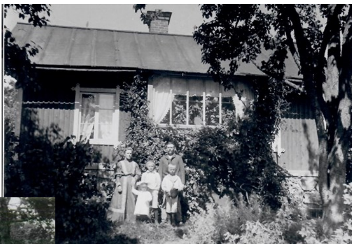
Familjen vid Västergården 1915.