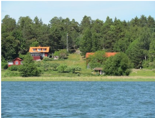
Västergården idag, från sjön.