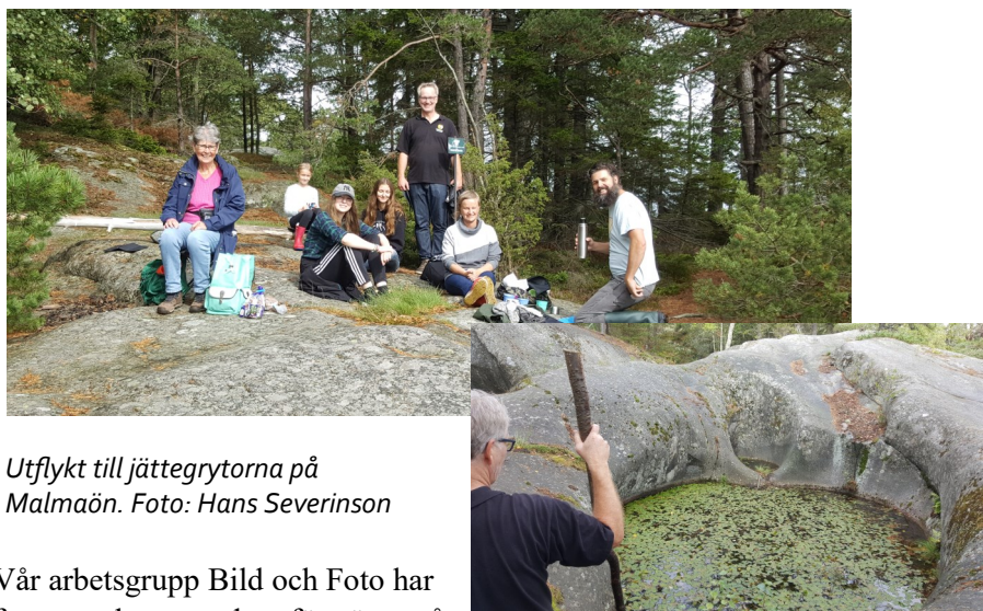
Utflykt till jättegrytorna på Malmaön.

Utflykter har arrangerats vid tre tillfällen. Under våren gjordes besök vid museet Hamn i Fisksätra och Skärgårdsmuseet i Stavsnäs, och under hösten en vandring till jättegrytorna på Malmaön.