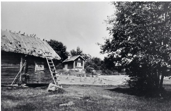
Bagarstugan 1926 från sjösidan, lägg märke till uthusets vasstak, som var det ursprungliga takmaterialet för byggnaderna.

Bagarstugan , av timmer under tak av tegel på bräder, 7,1 m lång, 3,6 m bred och 2,6 m hög; Nya vattenlister och nytt skorstenbeslag, ugnsrilen omlägges.