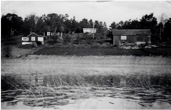
Västergården ca 1950, sett från sjön.