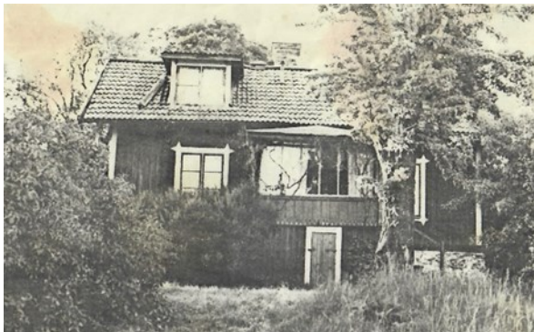
Västergården 1976.