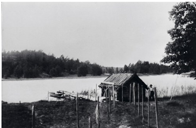
Oskar vid sjöboden 1905.

fisket på sitt sätt, med avsteg från den nya fiskestadgan. Ansökningsärendet och gällande fiskestadga finns i en annan artikel i det här numret av medlemsskriften.