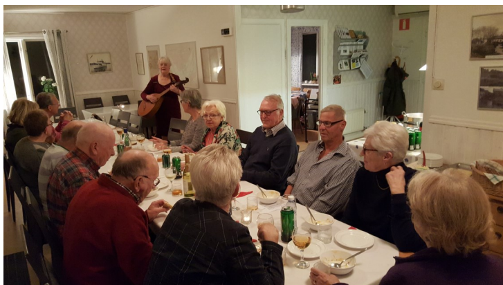
Middag med sång och musik efter höstmötet 2017.