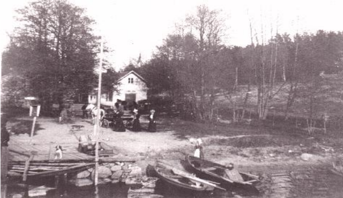
Strömma Handel 1895.

Tyvärr blir det nog inte så den här gången.