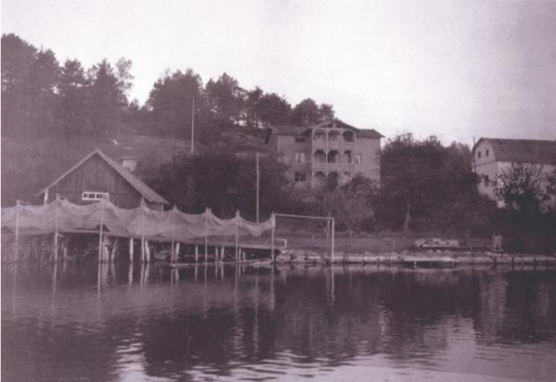
Övre bilden: Strömma Gård med kvarnen till höger