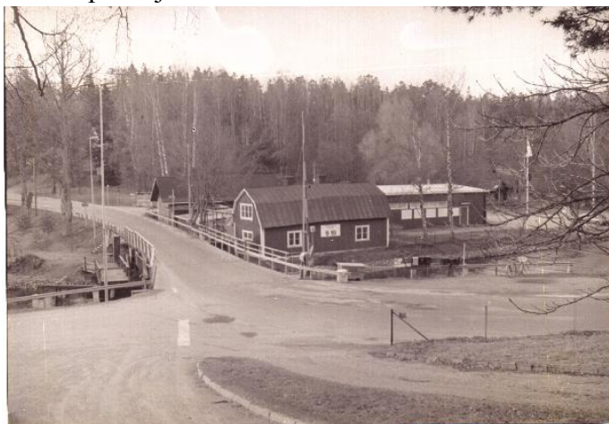
Varuhallen färdigbyggd 1969.