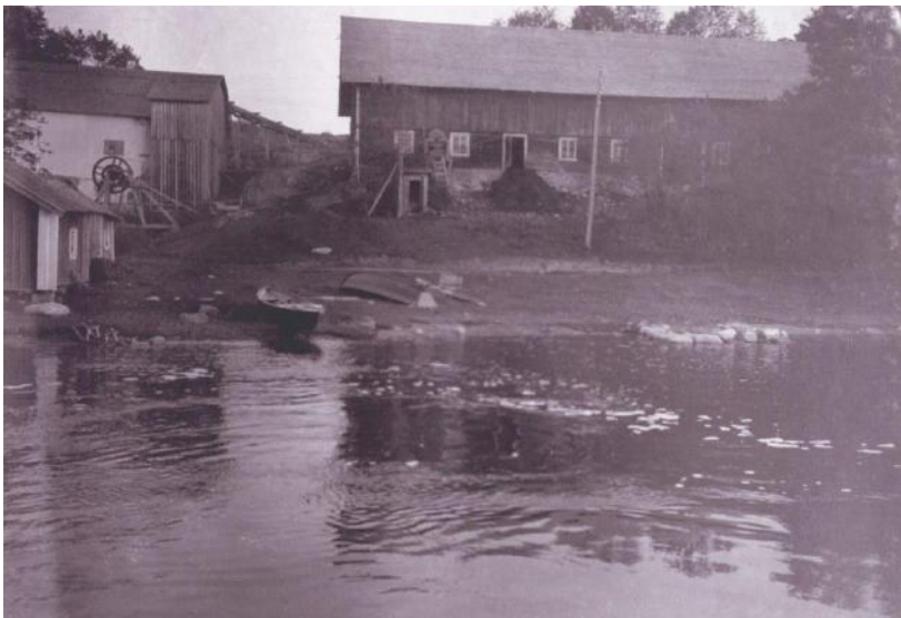
Nedre bilden: Ladugården med kvarnen till vänster.