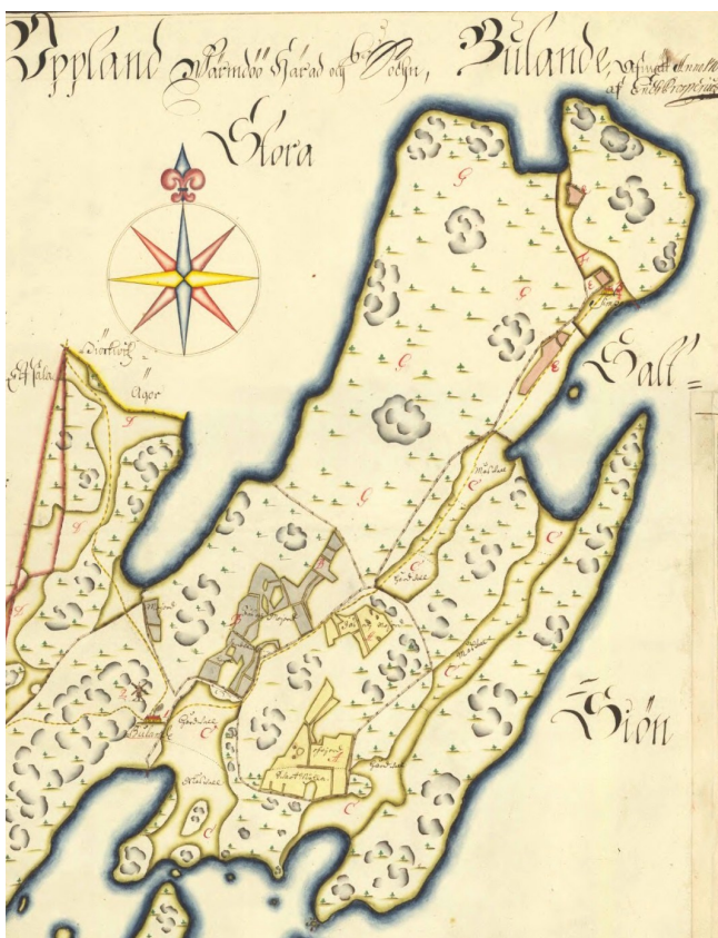
Karta, år 1704

Av texten på kartan kan utläsas att bonden hade fråntagits gården på grund av att odlingsmarkerna missköts. Istället fick socknens länsman som lön avkastningen från gården. Vid denna tid bodde komministern i Djurö församling under några år på Bullandö. Gården brändes sedermera av ryssarna 1719.