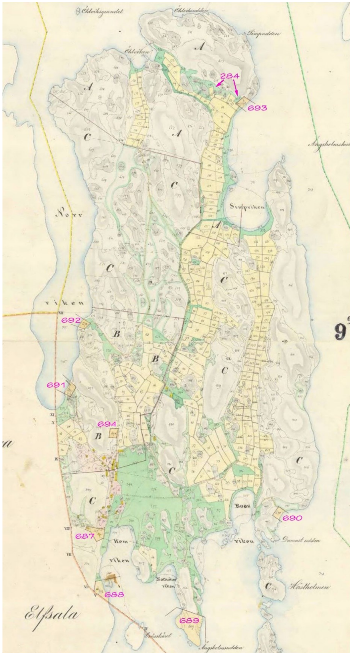
Karta, år 1865