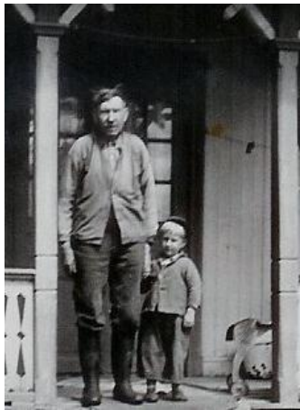
Farfar och jag i Lenhöjda