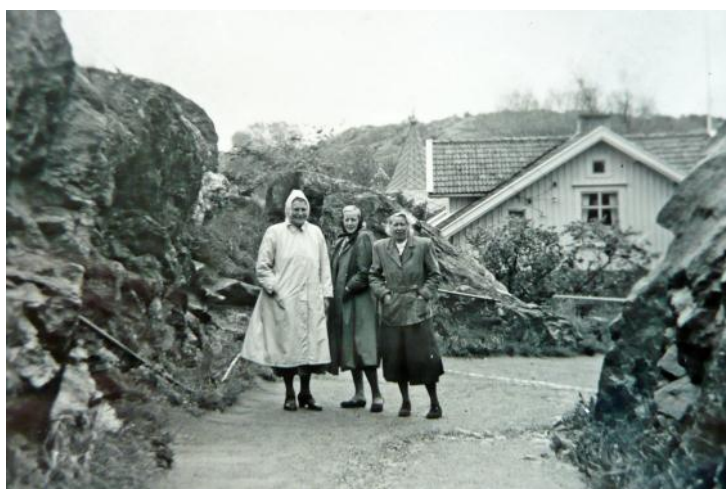
Tre damer i Kyrkeklevet. Vägen är breddad 1962.