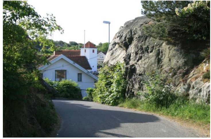
Kyrkeklevet innan sista sprängningen 2008-06-01.