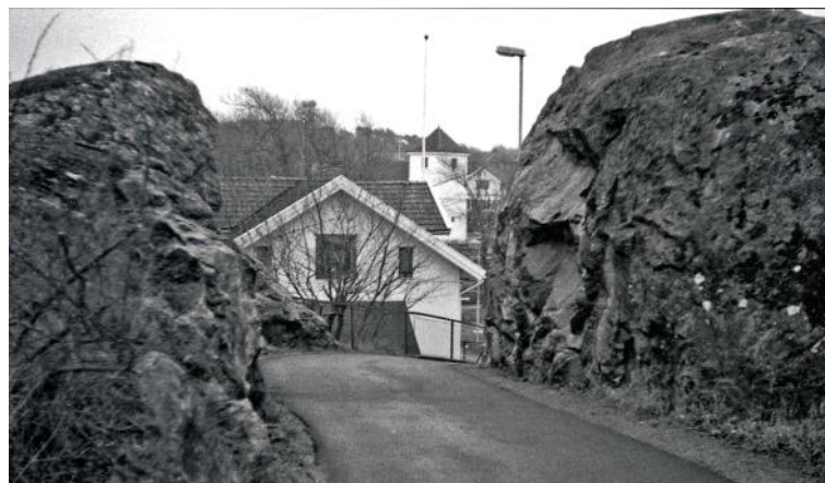
Vägen är nu asfalterad. Ur Frank Engelbrectssons bok "Styrsö 1978"