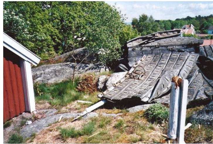
Sprängning av Kyrkeklevet juni 2009