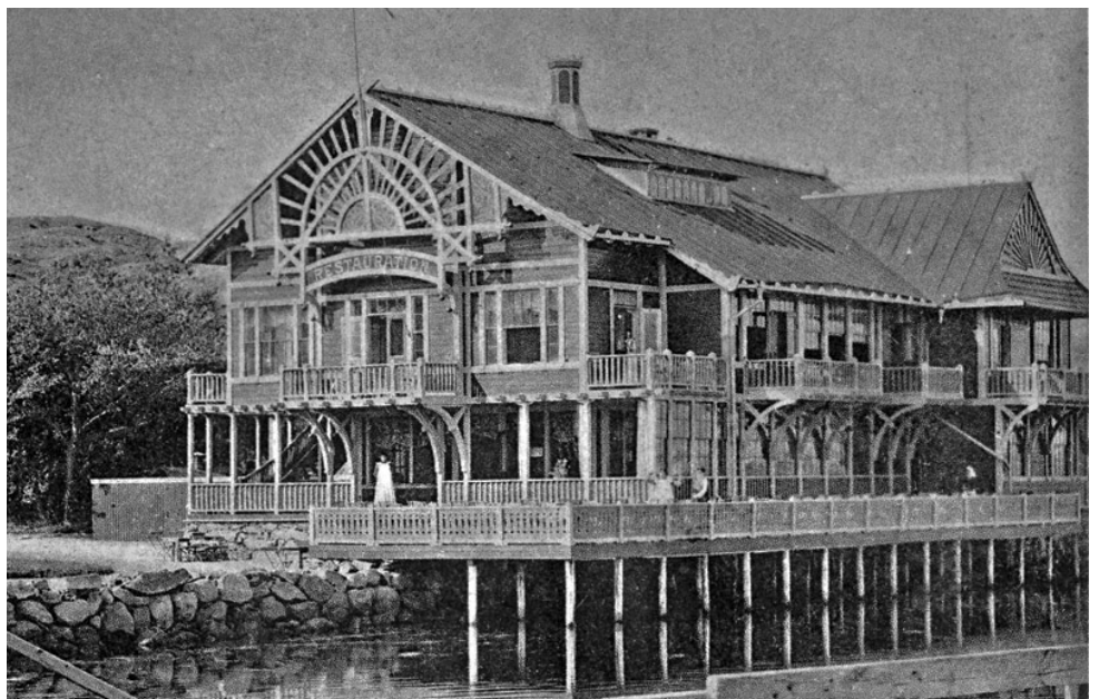
Stjärnviks värdshus på Vargö före branden