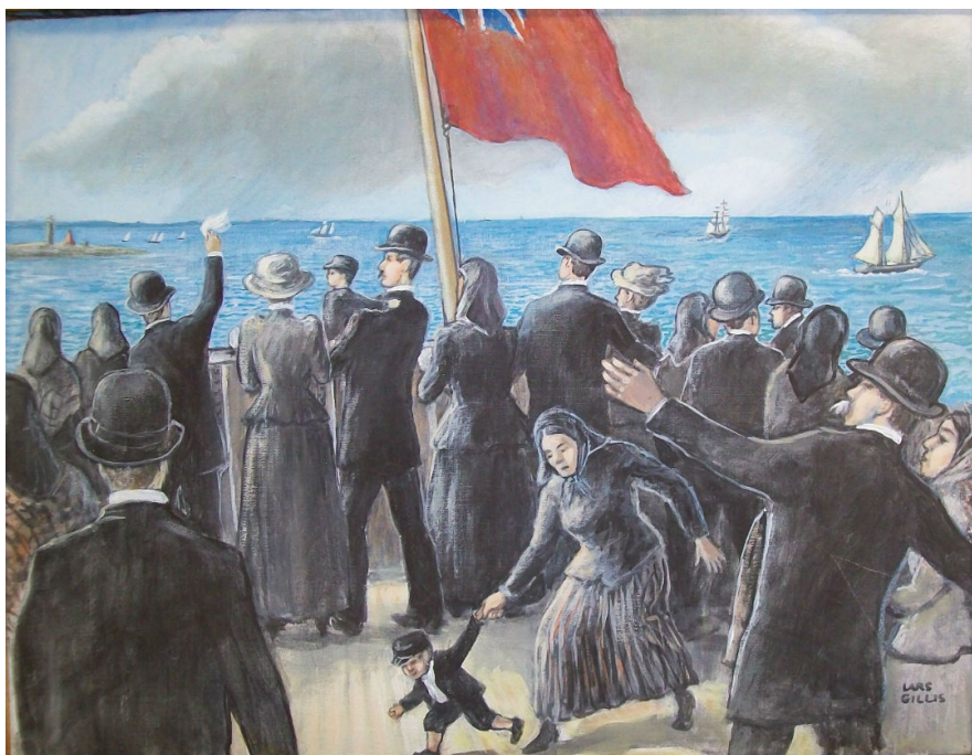
Emigranter vid Vinga på väg till USA.

Dan Broström tog steget till transocean linjesjöfart år 1907 genom tillkomsten av Svenska Ostasiatiska Kompaniet. Den alltmer växande sjöfarten ställde även krav på nya bättre hamnanläggningar. Till att börja med byggdes Stigbergskajen 1906–