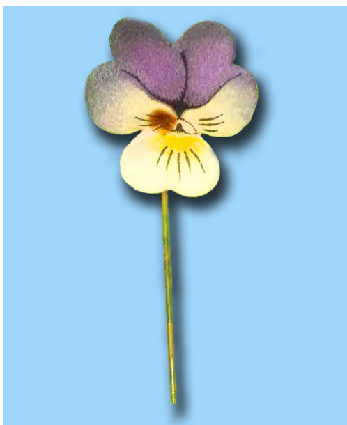
Majblomman 1916 – en styvmorsviol – samlade ca 17.000 kr, varav merparten överläts till "hämmande av tuberkulosen", kanske delvis till vårt sanatorium på Skäret?

Av stor betydelse för skärgårdsbornas livsmedelsförsörjning var det faktum att många ägnade sig åt jordbruk och djurhållning – alltså inte primärt fiske! Mjölkkor hölls på bete bortom byns tomter, liksom får. Många som inte var jordbrukare hade en gris som fick gå för sig själv. Men den måste ha ring i trynet, annars bökade den upp och förstörde för mycket. Det var dryga böter på att ha sin gris oringad på allmän mark. Handelsträdgårdar för grönsaker och frukt anlades – inte minst av Gus-