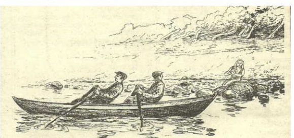
□ Vidskepelse, »getsk», var vanligt förekommande bland fiskarna. Övernaturliga väsen förekommer ofta. En del fiskare som kunde »se» såg syner de aldrig kunde glömma. T. ex. denna – en underbart vacker kvinna som med guldkam kammade sitt långa gula hår som räckte nedom midjan. Det var havsfrun.