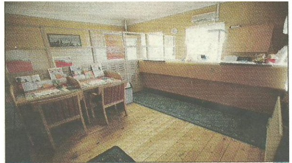
I det gamla missionshuset i Eskelhem har banken huserat sedan början av 2000-talet. Dessförinnan låg banken söder om kyrkan.