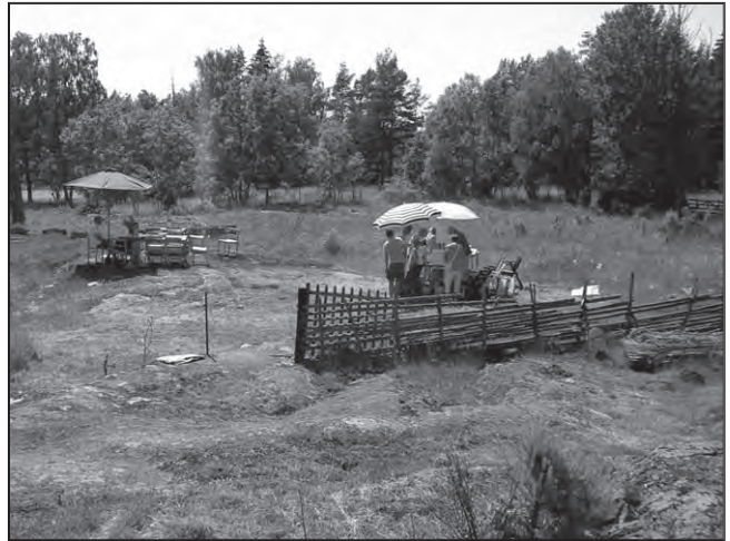
Föreningen bjöd på lite svalka med fika och parasoll

Hembygdsföreningen bidrog med kaffeservering.