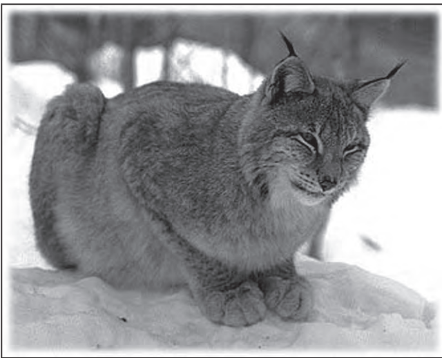
På sommaren är lodjurets päls gulbrun och fläckig, men på vintern är den ljusare, mer gråaktig och fläckarna syns inte lika tydligt. Svansen är kort och kraftig med tydlig svart spets.

Lodjur var för några år sedan endast tillfälliga, men nu finns de mera permanent på Tvärnö. En hona som föder årliga ungar lever främst på Raggarö. Under lodjursjakten mars 2010 sköts inget lo på Tvärnö. Några Tvärnökatter har tyvärr blivit mat till lo.