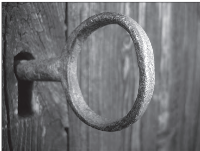
Den fina nyckeln till kvarnen

Norrgården höll kvarn, smedja och linbastu öppen. Tipspromenaden som arrangerades av Upplandsstiftelsen som många deltog i slutade på Norrgården.