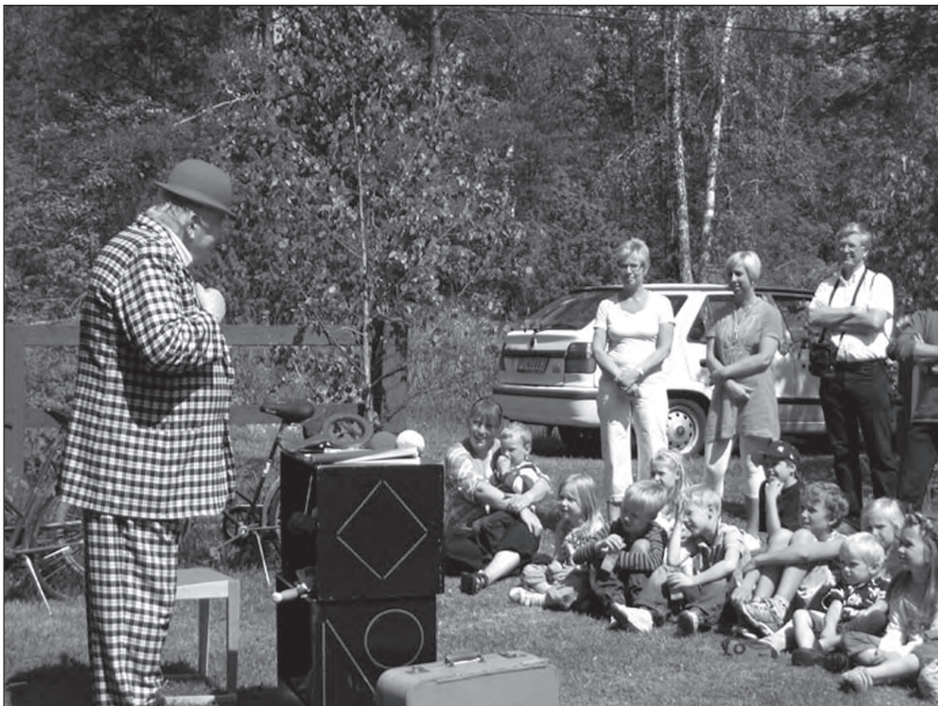
Trollkarlen underhåller barn som vuxna. En trevlig nyhet för denna sommaren.

Firandet av midsommar gick som vanligt av stapeln på midsommar-DAGEN klockan 12 och många vara med för att hjälpa till med klädsen av stången. Flera av de som kom hade blommor med sig så arbetet gick fort.