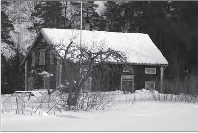
Den tillbygda huvudbyggnaden på Hästhagen som den ser ut idag. Ett mindre hus flyttades hit från Yttersby under 1800-talet.