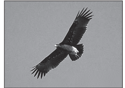
Skrikörnen som visat sig på Tvärnö är mindre än vår numera ganska vanliga havsörn

äppelträd. De kan också springa ifrån sina fiender främst lo och räv, eftersom de först av alla kan hoppa på skaren som bär dem. Det händer att örnarna tar harar. Kanske inte havsörnarna som är för dåliga flygare för att ta vuxna friska harar men harungar har det nog svårare. Kungsörn har setts, men det är oklart om de har häckat på Tvärnö. Det har däremot en sällsynt örn, skrikörn, gjort. De är högst ovanliga i Sverige, men kommer över Åland från Baltikum.