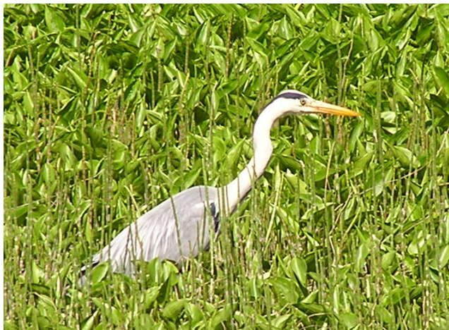
Hägern vid Åbäcksholm

Någon frågade varför vi satt ut en plåtfågel i Vammarsmålaån vid hembygdsgården. ”Den måste vara konstgjord för den rör sig ju aldrig.” Fel! Det är en livs levande häger som sedan i våras har valt att fiska vid Åbäcksholm. Hägern beskrivs i någon fågelbok som ”den tålmodige fiskaren”, då den kan stå blick stilla i evigheter och vänta på att en fisk eller groda skall passera framför sina fötter. Framåt eftermiddagarna har den fiskat färdigt och lyfter för att flyga hem. Var den bor vet vi inte. Kanske ända ute vid Källskär, där det finns en koloni på över 100 par.