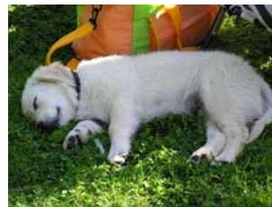
Sov under hela firandet.