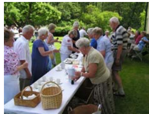
Ständig kö vid fikabordet.