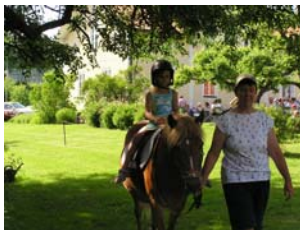
Ponnyridningen var poppis.