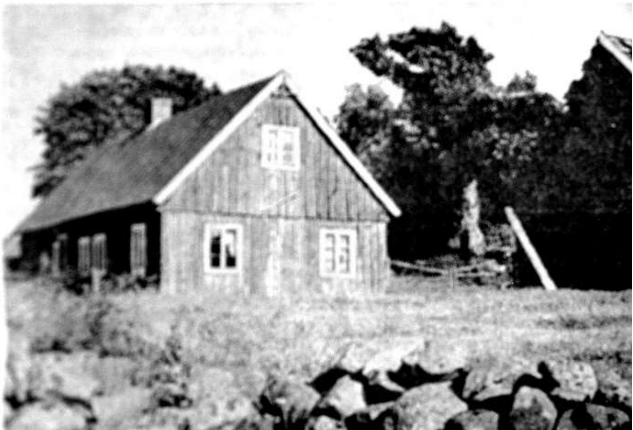
Stugan i Lärka Sjöholt 1960

Dessutom att övervaka och i möjligaste mån skydda fasta fornlämningar, äldre byggnadsminnesmärken och märkligare naturminnesmärken inom verksamhetsområdet och att verka för naturvård och naturskydd.