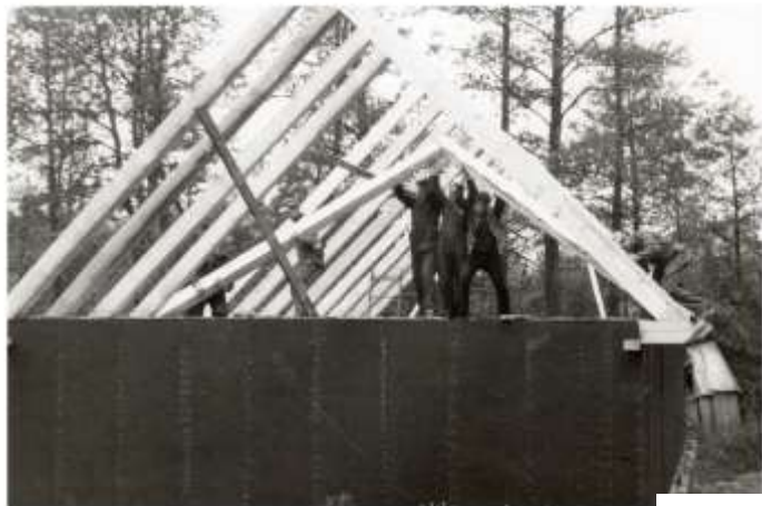
Kransen på väg upp