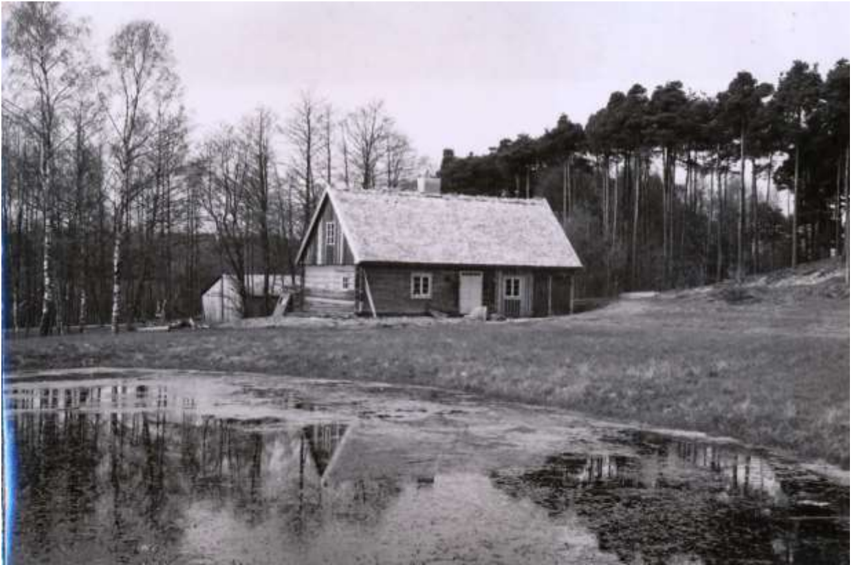
..... och på plats i Våxtorp 1962