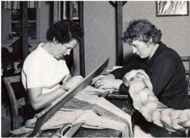
Första vävkursen i stugan, 1962-63