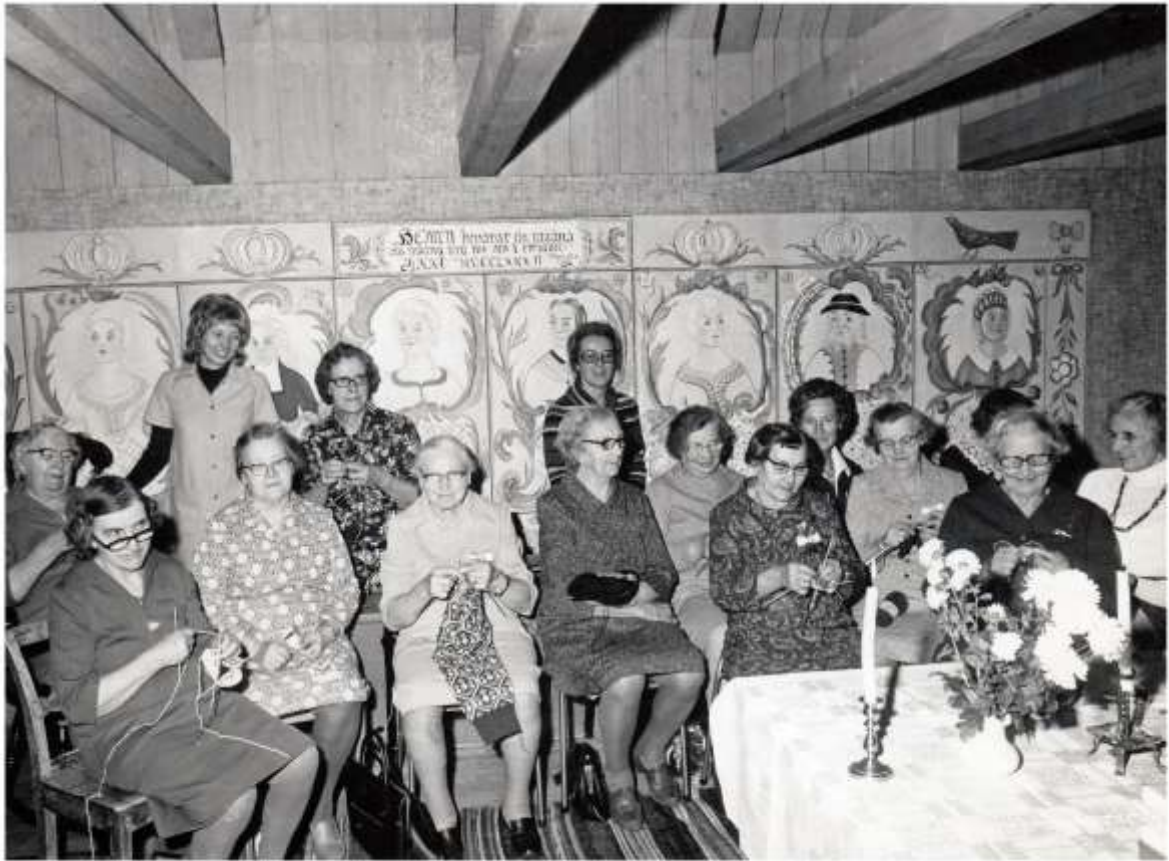
Bingegille i Hemslöjdens regi