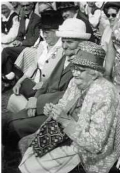
Mästare i hallandsbinge