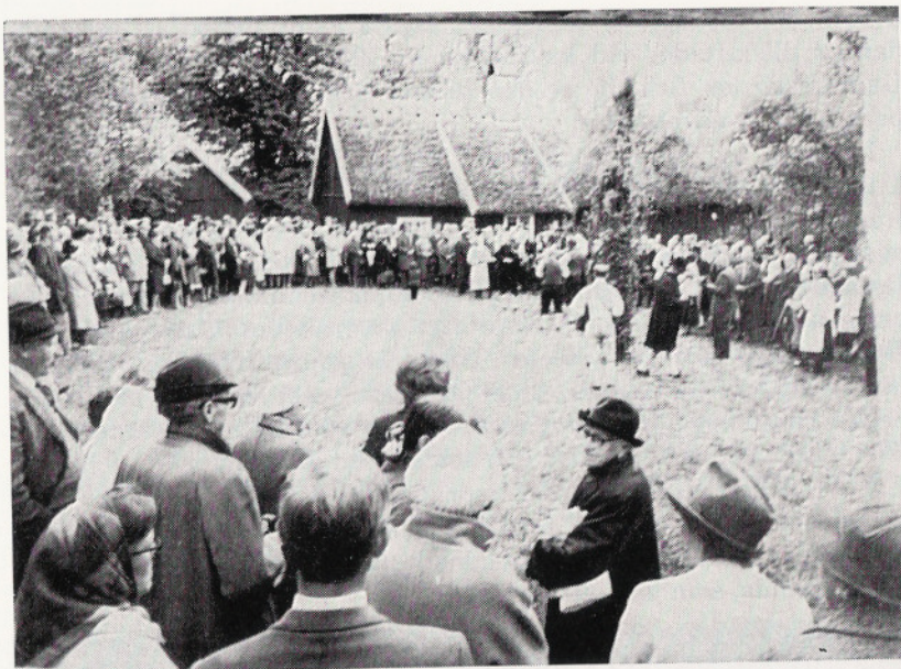
En bild från spelmansstämman i Gunnarstorp den 1 juni 1969, då spelmän från nästan hela Götaland och därtill en talrik publik mött upp.

Golvet är av mycket breda granbräder. Ett mindre rum med rund kakelugn ligger till höger om förstugan.