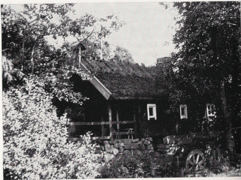
Vid Gammelgården i Gunnarstorp finns bl. a. denna idylliska kvarn från 1700-talet.