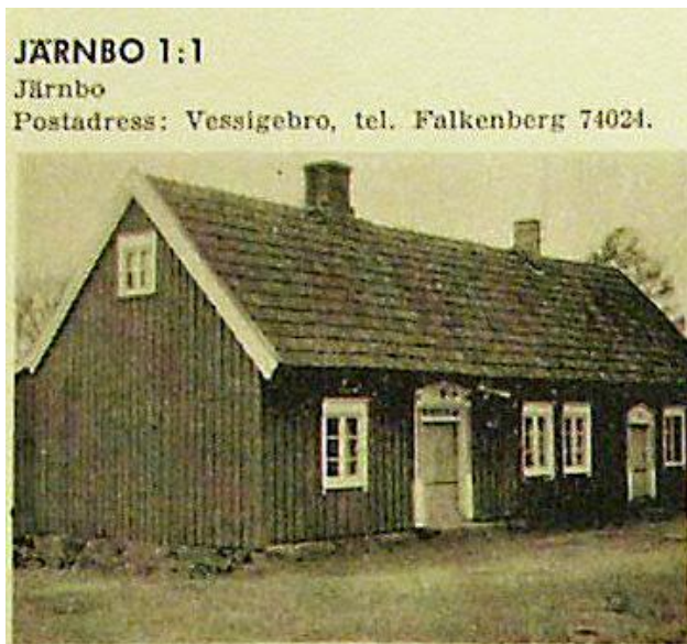
Järnbos mangårdsbyggnad var ursprungligen från 1853