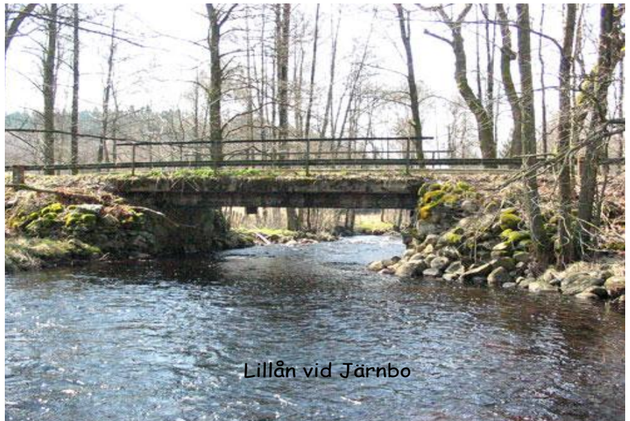
Lillån vid Järnbo

Skilnaden omkring denna skoug först efter innersta Swahlås Bäckten till Hukereds Åhn, sedan efter den åhn till Jernboo. I skougen planterings hage, Muhlabetet got. Qwarn ställe finnes intet, fiskewattn uti en liten åå rinner jemte gården, hafver del uti ett åhle-fiske med Lyngen, dock mycket odugeligt.