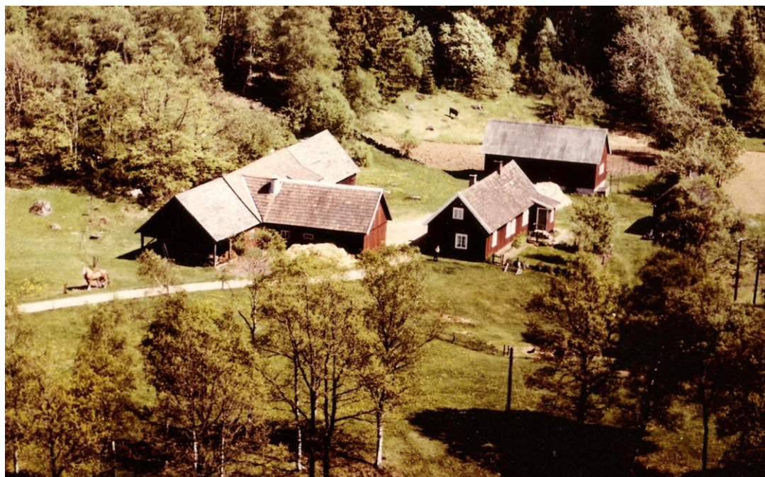
Gården Järnbo, flygfoto från 1950-60talet

År 1994 ägs gården av Esbjörn Nylander. Den fina mangårdsbyggnaden (se också bilden ovan) är nu riven. Ladugård och ekonomibyggnader finns kvar.