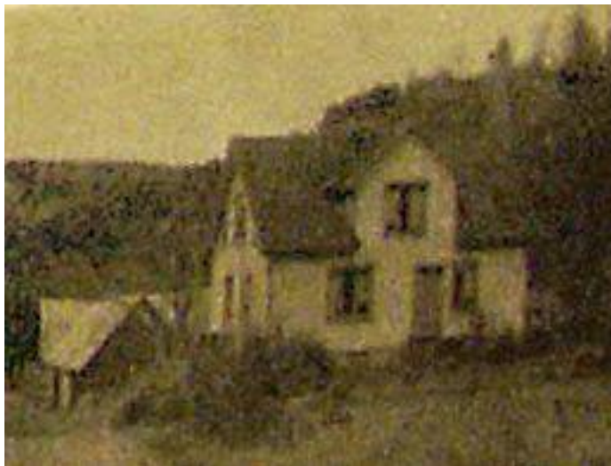
Lyngen 1:1 omkr 1964

Mangårdsbyggnaden från 1934 renoverades grundligt 1967.