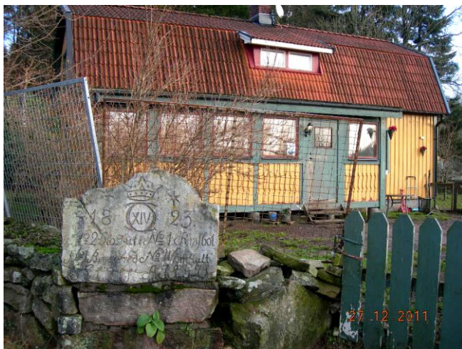
Nytagen bild av Björbäcksered 1:3

fastigheten för 725.000 kronor (tax.v. 314.000) av Berith Maria Larsson. På samma adress drivs en hundkennel med rasen rottweiler ("Fjellalunda´s hund")