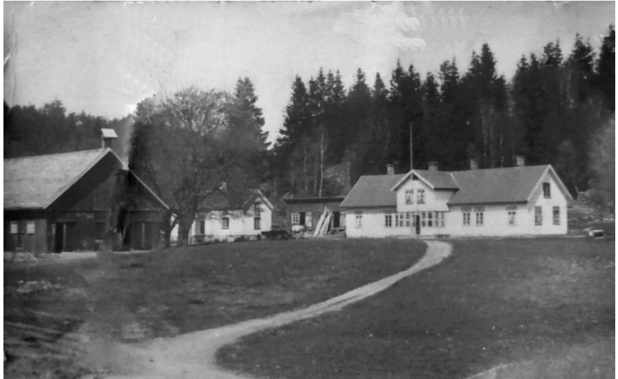
Gården 1919