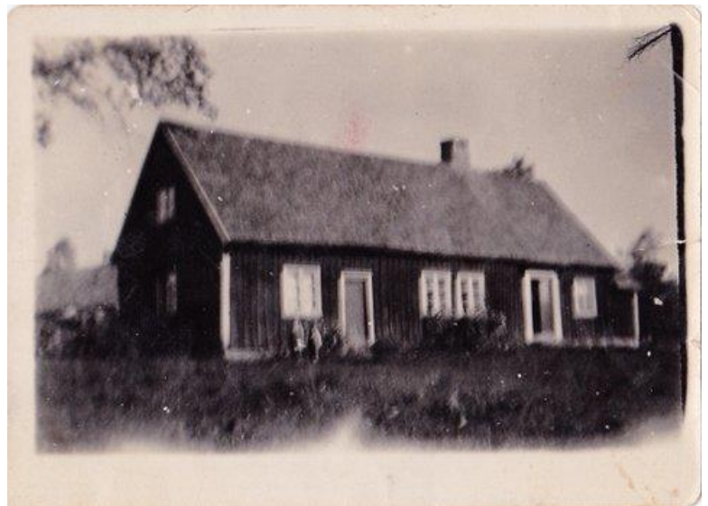
Bostadshuset i Lunnabol 1:5

Ur mannens bouppteckning 1935: Tillgångar ca 1.200 och skulder ca 880 kronor. Värdet av fastigheten tas inte upp och inte heller några kreatur, vilket betyder att de redan lämnat gården ifrån sig, troligen till Hilding Johansson, som häftade i skuld till föräldrarna med 4.000 kronor.