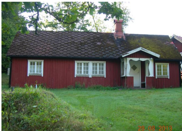
Nytagen bild av bostadshuset på 1:11 och ruiner av ladugården?