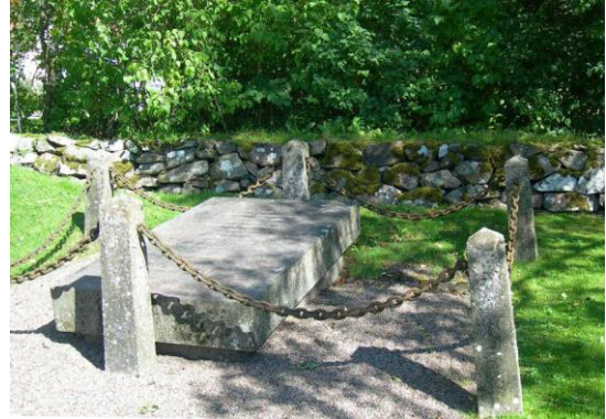
Severin Cederbergs familjegrav

Föräldrarna och de flesta av barnen är gravsatta tillsammans på Vessige kyrkogård under en bastant stenhäll