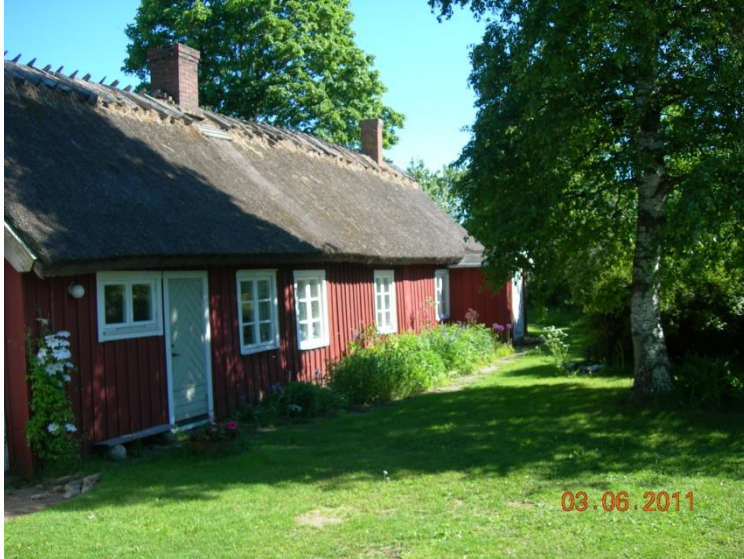
Bild 2011 av huset från vägen

Enligt en uppgift kan huset vara byggt runt 1830 och det sägs ha varit större än det är idag. En del av huset som låg "åt Vessige till" har tagits bort. Landsvägen gick på andra sidan huset, innan vägen rätades omkring 1930. För att få fram säkra uppgifter om husets äldre historia krävs mera forskning.