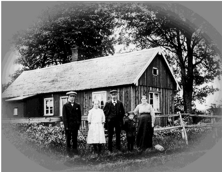
En statarfamilj i Bohl 1917

En inventering av torp, statarbostäder och backstugor under 1700-1900-talet i Vallby och Bohl i Alfshögs socken