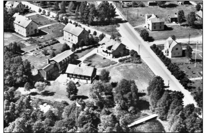
Ålandsö. I högra hörnet ses bron till Missionsparken.