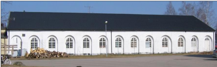
Södra fasaden av C. Svenssons smedja.

http://www.platsr.se/platsr/visa/plats/id/479