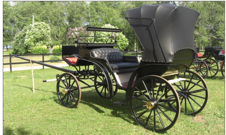
Kalesch tillverkad av Vaggeryds Vagnfabrik C. Svensson. Kalesch är en paradvagn med motställda säten dragen av parhästar. Ägare – 2014 är Per-Olof Gustavsson, Örsby Sävsjö.