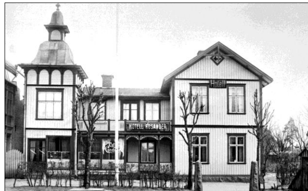
Hotell Rosander omkring 1920.