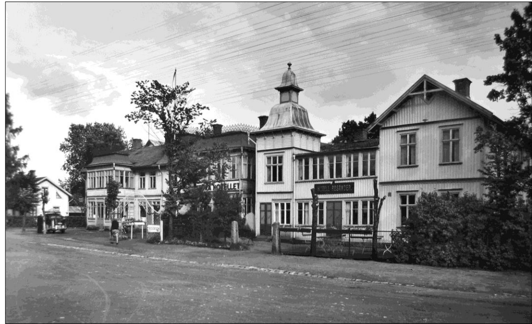
Från vänster ses Magnus Magnussons hus/Magnisa stuga/ på sin ursprungliga plats, Stora Hotellet och Hotell Rosanders. Foto från 1940-talet av Evald Gustavsson.

http://www.platsr.se/platsr/visa/plats/id/478