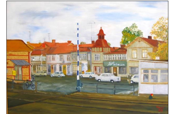
Järnvägsstationen med Pressbyråns kiosk och de gamla hotellbyggnaderna. Oljemålning av Toni Gustavsson /Fotoni/